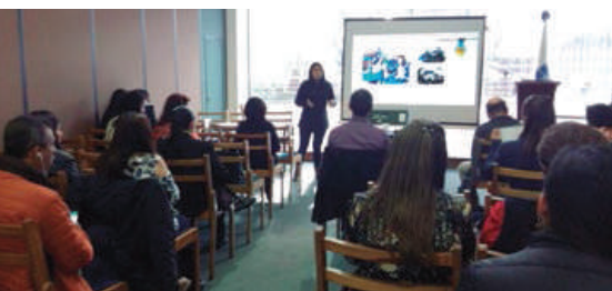
► Socialización de experiencias y conferencias de expertos.