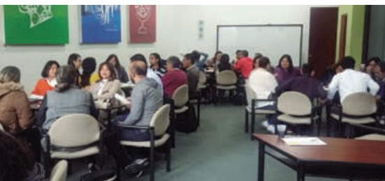
► Mesas de trabajo por temas de interés.