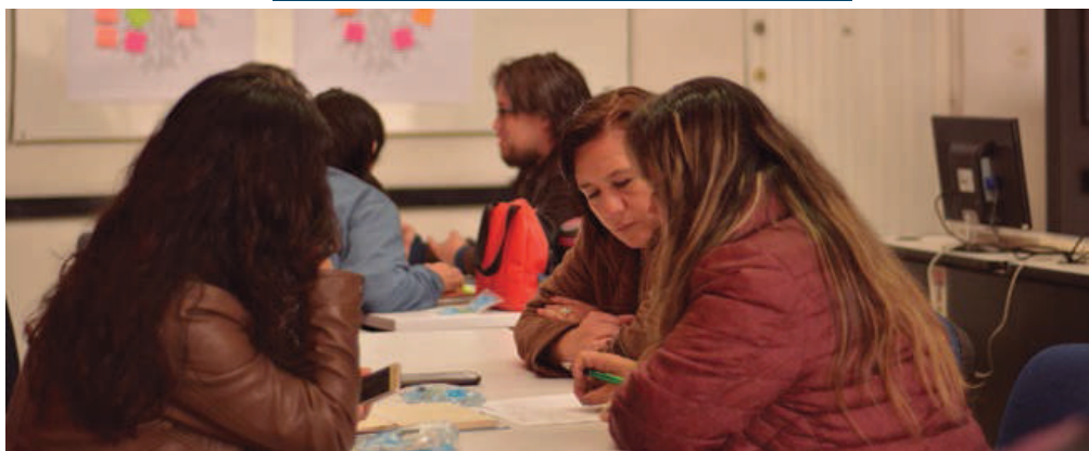
► Estrategias para la planeación participativa.

Posteriormente, a partir de los diversos intereses de los docentes y las instituciones en torno a la evalua-