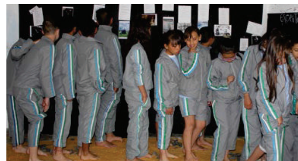
Ejercicio de lectura de poemas en el festival del lenguaje.

...el lenguaje y el pensamiento son corporales, y por tanto involucran nuestros afectos, nuestras sensaciones y movimientos. La lectura y la escritura son, más allá de prácticas escolares, una forma de descubrirnos.