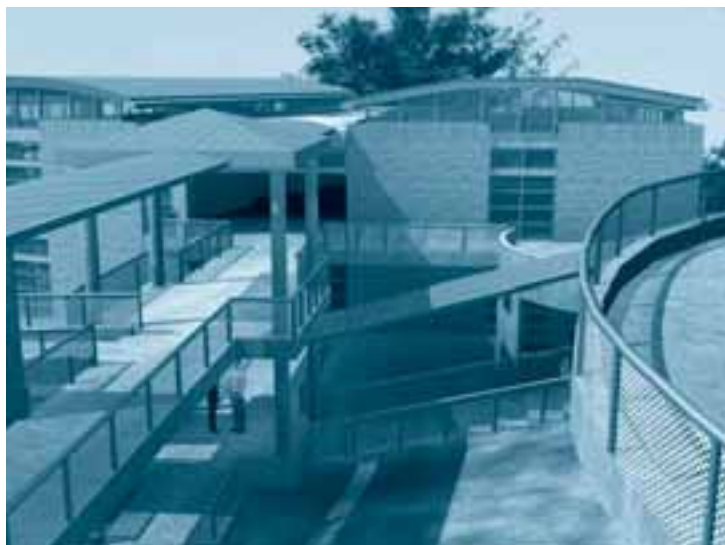
Detalle de las rampas de acceso que unen las diferentes áreas del Colegio El Bosque.