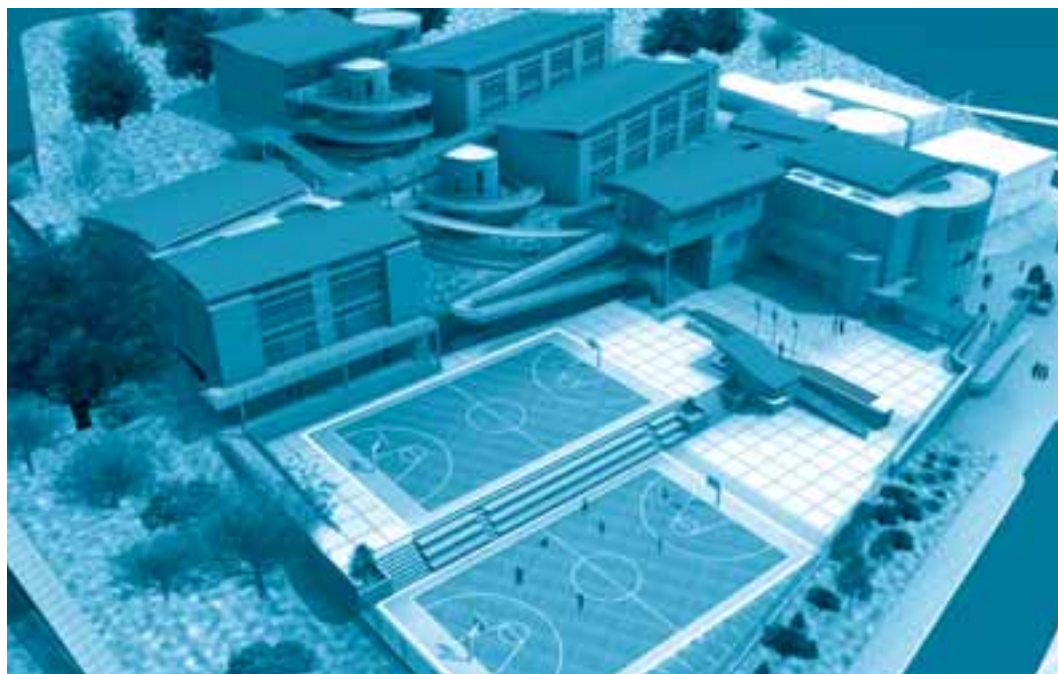
Render: Departamento Planta Físicas, SED.

El plan de obras está en marcha, lo que implica de hecho un reto grande: que puede convertirse en agravante de la ya complicada vida en la ciudad y en la normalidad académica, o puede ser esa oportunidad para que