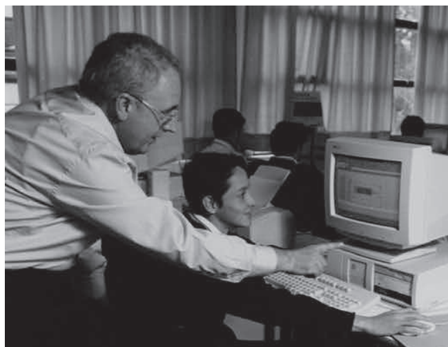
Figura 4. Líderes para el siglo XXI

En el despliegue de estas tensiones entre investigación, innovación y formación, que atraviesan la práctica docente, es posible retornar a sí mismos, pensar de qué otros modos es posible configurar una propia experiencia que, más allá de generar prácticas novedosas o ejercicios formativos de lo que se espera generar en otros, permita encontrar espacios de despliegue de su existencia como maestros, otras maneras de gobernarse y hacer que los otros puedan, a su vez, gobernar sus vidas en formas distintas.