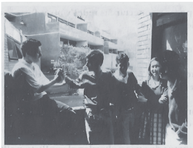
Figura 6. Expedición pedagógica

La expedición pedagógica es una movilización social por la educación, realizadas por maestros, profesores e investigadores, quienes a la manera de expedicionarios, viajarán por escuelas, colegios, instituciones formadoras, pueblos y ciudades, propiciando encuentros e intercambios con los actores el proceso educativo para explorar, reconocer y potenciar la riqueza y la diversidad pedagógica existente en la educación en Colombia (UPN, 2000, p. 3).