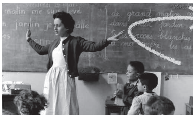
Figura 2. Enseñantes y aprendices a lo largo de la vida

En tal sentido, es importante mencionar que aún cuando muchas de las prácticas que recaen sobre los maestros se instalan en la lógica de la calidad, y aunque esta no solo logra capturar el escenario educativo sino incluso las prácticas de vida, es posible pensar de qué otros modos las investigaciones realizadas por los maestros pueden hacer pensar sobre este asunto, de tal forma que, antes que un hecho o un resultado por esperar, se pueda constituir en objeto de problematización de las mismas prácticas que configuran los sujetos, en particular, los modos de ser y quehacer de los maestros. Hay entonces un campo amplio de posibilidades en las investigaciones de los maestros que permitirían trazar espacios, incluso no capturables, sobre lo que hacen, pues su práctica desborda los propósitos y da lugar a pensar en objetos relacionados con su misma experiencia de vida que, además, es compartida con otros; en la confluencia de relaciones establecidas a propósito de las investigaciones de los maestros, es posible configurar modos de existencia que permitan pensar acerca de la propia vida y las posibilidades de conducirla en otros modos.