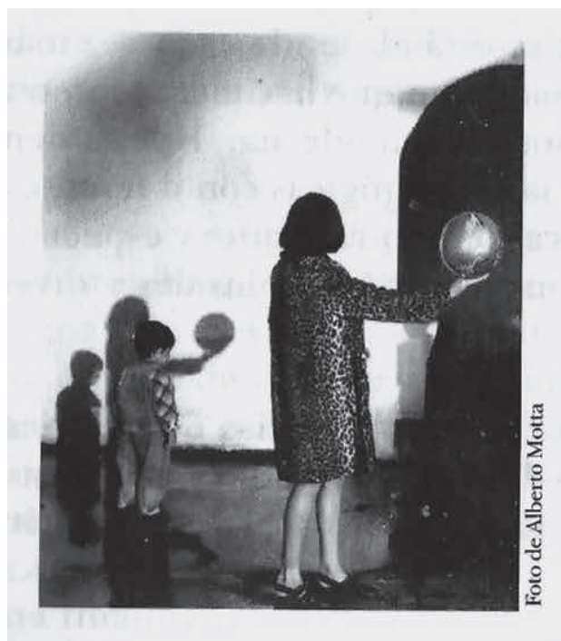
Figura 5. Proyecto expedicionario