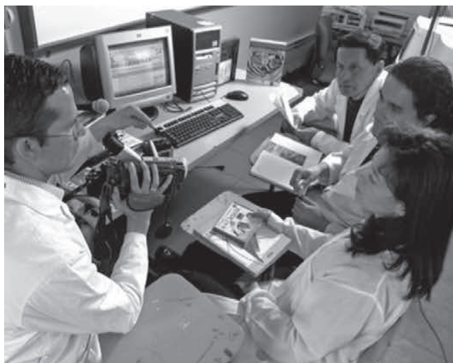
Figura 3. Los maestros de la innovación

En contraste, se encuentran investigaciones cuyo objeto es el maestro, en las cuales no solo se pretende contribuir con la transformación de sus prácticas, sino con la problematización de sus modos de constitución; de manera que si bien las investigaciones realizadas por los propios maestros dan cuenta, en muchos casos, de sus propias prácticas, es importante considerar que la investigación sobre las formas de ser maestro en la actualidad puede dar cabida a una toma de distancia de las mismas para pensar su experiencia de otros modos.