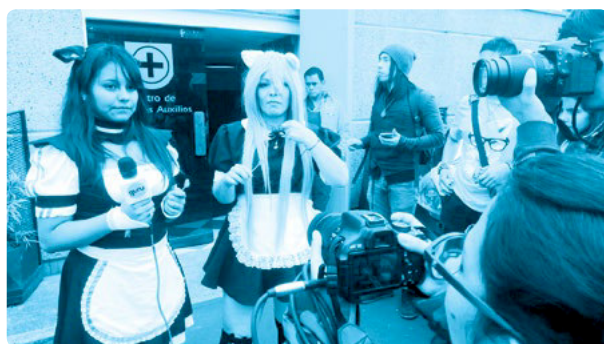
Imagen 2. Personajes

En la escena dos chicas son entrevistadas, asumen emotivamente el goce que les implica la imitación, reiteran gestos y ademanes de los personajes que simulan y a la vez tratan de defender su diferencia. El relato en el que inscriben su disfraz se centra en la fascinación que les producen los personajes de Nekopara Cats Paradise , tratan de serlo mientras son entrevistadas, salen de sí para reafirmar lo que simulan. No hablan como el personaje, su cuerpo lo representa,