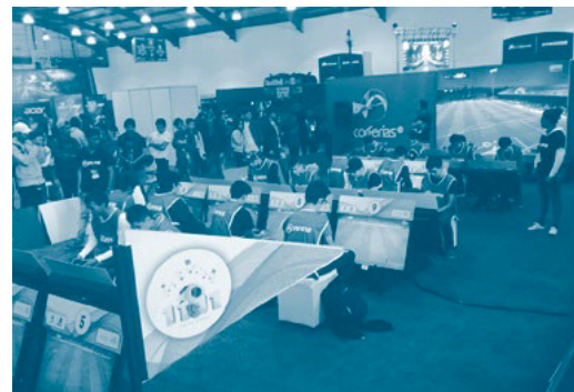
Imagen 4. El nuevo campo de juego

Un buen ejemplo lo constituye el espacio institucional de ETB: una cancha de fútbol en la que se ingresa por un túnel al estilo de un estadio; los jugadores se visten con un peto de color rojo o azul según su equipo y toman una posición en el espacio, de acuerdo a la que asigna la consola de juego. Mediante un control y un televisor personal, el jugador comparte, junto a otras 21 personas, un partido de fútbol que el público puede ver en la gran pantalla que acompaña el estadio. En el desarrollo, sus cuerpos vivos se reclaman unos a otros las jugadas mientras sus jugadores se despliegan en el terreno virtual. Los toques, los golpes y los goles se celebran de manera mecánica en la cancha virtual.