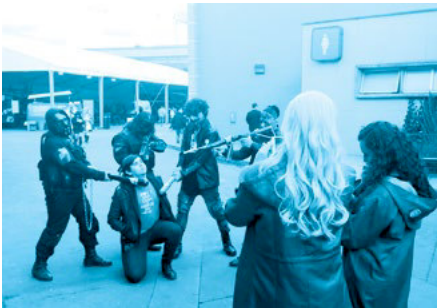
Imagen 3. La Masacre

La pluralidad de comandos, al estilo Assassin's Creed , propios de cómics, series y videojuegos que paseaban por el SOFA, producía la reiteración narrativa de un relato similar, el sacrificio de la víctima. Una y otra vez, insertos en esa apuesta de relato, diversidad de participantes pedían el espacio, se arrodillaban y solicitaban ser sacrificados mientras sus acompañantes los fotografiaban logrando el mejor ángulo. Esto representaba la puesta en escena del propio sacrificio y, a la vez, la captura del instante en el que se toca la frontera entre ser la víctima privilegiada de los asesinos de culto, la traducción de la masacre y el sacrificio, en un salto simbólico superado en el simulacro. Es la representación del reconocimiento basado en la repetición persistente de la muerte ficcional.