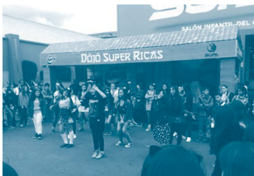
Imagen 5. La Sincronía Social

Sin embargo, es el mismo público quien asume el papel atópico, constituyéndose por fuera del beneficio comercial, pero incorporándose desde la construcción de una identidad compartida a través de la mirada de los otros, curiosos y receptivos, que visitan el lugar en busca de reconocer la habilidad expresada en el baile.