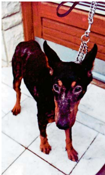
Slika 1. Doberman oboleo od demodikoze, karakterističan fenomen „naočara“ (original) /

Pregledom 76 pasa suspektnih na demodikozu, ustanovljeno je da su svi bili infestirani vrstom Demodex canis . Promene su bile lokalizovane ili generalizovane (slika 1 i 2).