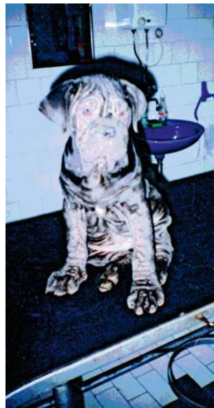
Slika 2. Generalizovana demodikoza kod šteneta napuljskog mastifa (original) /

Figure 1. Dobermann diseased with demodicosis, characteristic bald rings around eyes, so-called spectacles phenomenon (original)