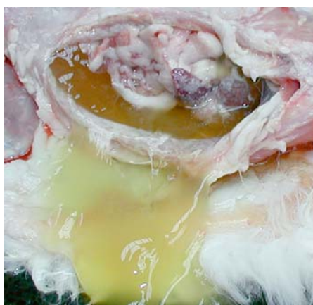
Slika 2. Eksudativna forma FIP-a / Figure 2. Exudative of FIP

Kod ostalih, zapaženi su granulomi veličine 1 do 2 mm smešteni u abdominalnom zidu, omentumu i serozi creva, ređe u jetri, bubrezima i slezini. Neke životinje imale su enteritis, nekrotični limfadenitis mezenterijalnih limfnih čvorova i hiperplaziju slezine, a kod dve mačke dijagnostikovano je fibrinozno-granulomatozni pleuritis.