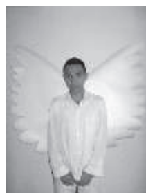
Figura 1. Cuadro de los superhéroes del colegio Bolivia sus poderes y debilidades