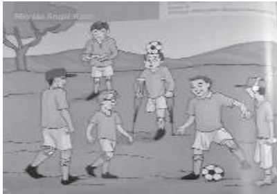
Figura 2. Estudiantes participando en el concurso «Leer y escribir 2014».