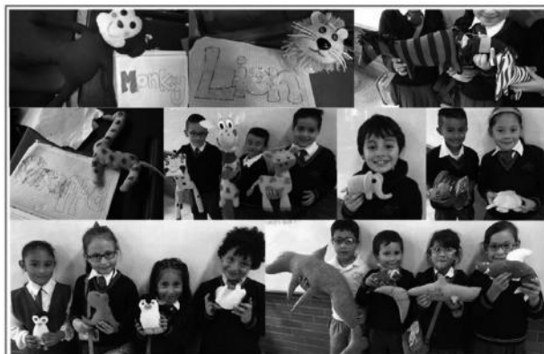
Figura 5. Animalitos elaborados por los niños y sus familias: trabajo en clase de rasgado con el nombre de cada animal

Se pide a los estudiantes crear un lugar para el animalito en sus manos, así que deben dibujar dónde vive, representando todos los elementos que conforman el hábitat: otros animales, vegetación, etc. Esta actividad permite que los niños sitúen su animalito en un contexto y hagan explícitas las necesidades cubiertas por el medio: refugio, alimentación, compañía, entre otras.