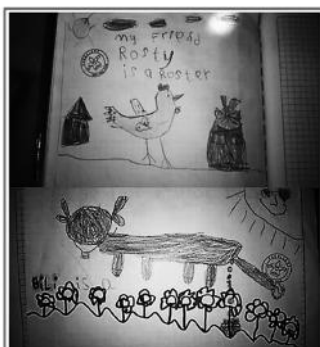
Figura 3. Dibujos de Rosty y Billy elaborados por dos estudiantes

A partir de la clasificación, codificación y análisis de los testimonios que los estudiantes recopilaron de sus familiares, es posible comenzar a comprender qué hay en la base de las relaciones de nuestras comunidades con los animales, para desde allí comenzar a generar procesos de transformación que nos hagan más sensibles y conscientes de la necesidad que tenemos de realizar una transformación de nuestras actitudes hacia ellos, propiciada desde el conocimiento que permite replantear la postura frente al otro ser vivo.