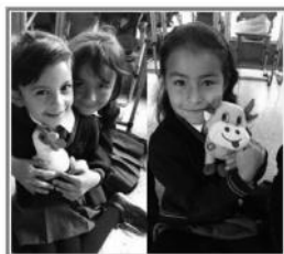
Figura 1. Imágenes de Billy y Rosty con los estudiantes en el salón de clase

A partir del planteamiento de diversos momentos, tanto en el aula como en casa, se pretende identificar sentimientos, actitudes y pensamientos de los estudiantes y sus familiares más cercanos, con respecto a temas como la tenencia responsable de animales de compañía, el maltrato animal, el abandono, la vida silvestre, entre otros. Para lo anterior se diseñaron tres episodios de clase, cada uno con dos o tres actividades con propósitos específicos, de los cuales se dará cuenta en el siguiente apartado, haciendo una descripción y análisis de las categorías que emergen al seleccionar la información obtenida en cada actividad.