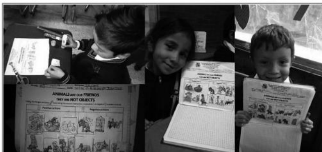
Figura 4. Taller con “cut-outs”. Los estudiantes debían recortar y pegar las imágenes clasificándolas en acciones positivas o negativas con los animales

En la segunda parte se acude a videos, para ampliar el tema y permitir a los niños y niñas tener un panorama más completo de lo que incluye el maltrato animal; por lo tanto se eligen algunos cortos animados y otros videos relacionados, a partir de los cuales es posible, no solo sensibilizar, sino movilizar a los estudiantes para que expresen sus ideas, sentimientos y emociones frente a lo que ven.