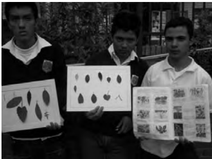
Estudiantes del colegio Brasilia