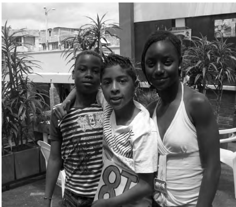
Estudiantes del colegio Brasilia-Usme. Grado 6°