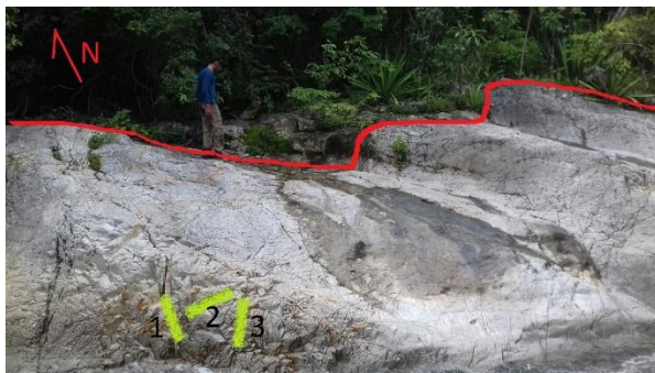
Figura 2. Foto del afloramiento, donde se evidencia el comportamiento tectónico afectado por la falla Rio Seco, con 3 familias de discontinuidades, en direcciones NW, SE,

Dentro de la Geología local, que se puede encontrar en el área de estudio, aflora una roca con alto contenido de sílice, que extiende en unos 500m en dirección N-E sobre el arroyo honda, que, por procesos fluviales, adquiere la geoforma vista en la Fig. 2