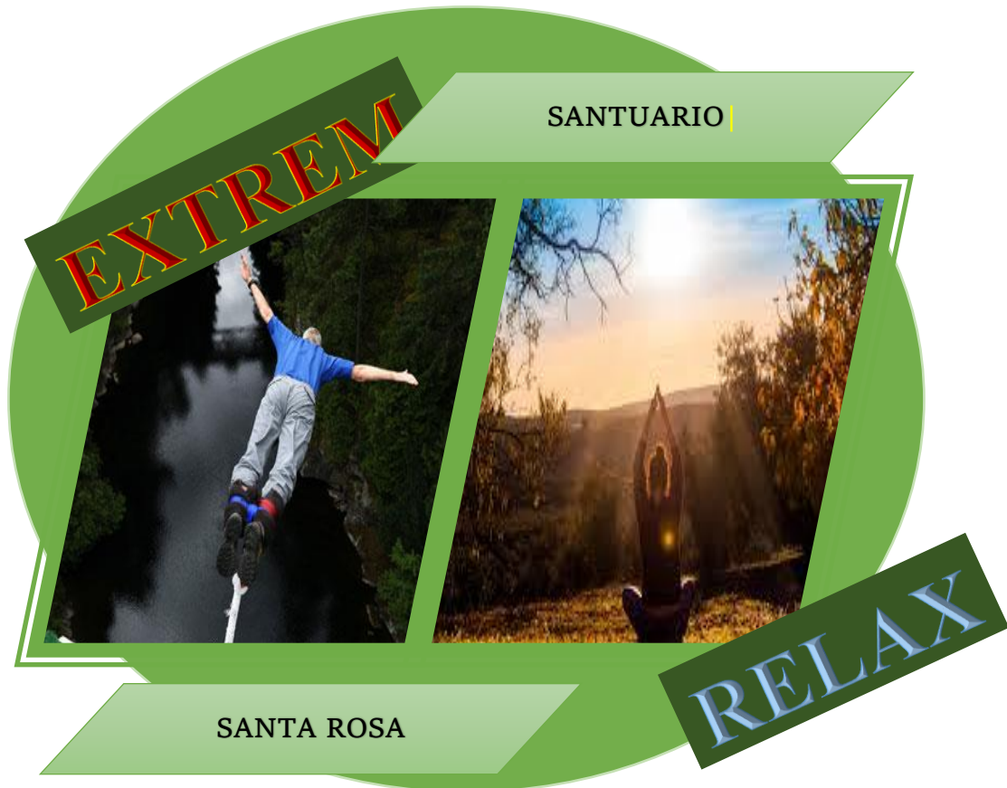
Ilustración 5: Campaña publicitaria

TURISMO RURAL RELAJACIÓN Y ADRENALINA Porque sabemos que te gusta ser extremadamente natural