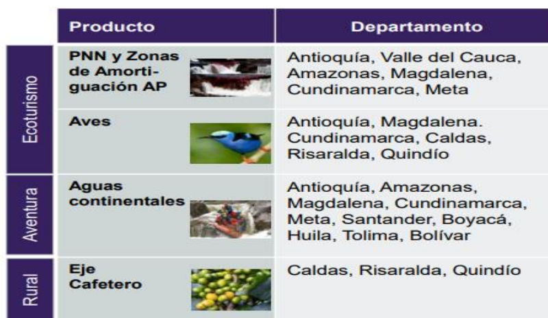
Ilustración 3: Competidores actuales

Nota 8: Tomado de: Orlando Ospina 2011, p. 12