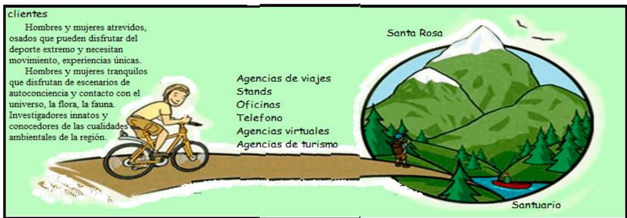
Nota 11: Elaborado por las autoras, creación propia.

El mapa de procesos para la prestación del servicio tiene en cuenta la oferta para dos tipos de clientes: el relax y el extrem. Ambos servicios se inician con la recogida de los visitantes en microbuses en el lugar donde viven o en sitios de encuentro. El desplazamiento hacia la cabaña, la entrega de la misma, la verificación de los planes de excursión que cada uno pagó o los paquetes por grupos que fueron elegidos, posteriormente se abre el espacio de conciliación sobre las medidas de protección y compromiso para finalmente salir a desarrollar las actividades planeadas en los diferentes sectores de la zona.