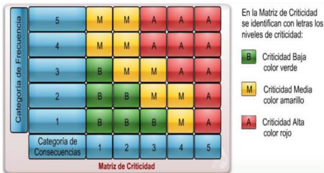
Figura 3: Matriz de criticidad. Tomado de Romero (2013)

Para el análisis de criticidad se debe realizar una matriz de frecuencia de fallas por la prioridad de las fallas de la siguiente manera: