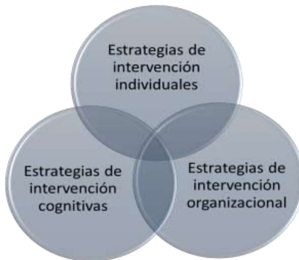
Figura 3. Estrategias de intervención

Esta propuesta permitirá que los docentes, mediante talleres de formación adquieran las habilidades para el afrontamiento y manejo de los factores de riesgo psicosocial.