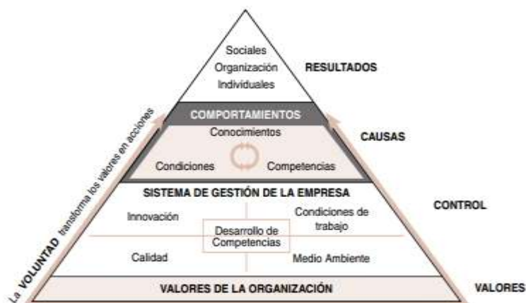
Figura 1. Modelo integral de Gestión Empresarial.

El establecimiento de mecanismos o estrategias de intervención del factor de riesgo psicosocial se debe abordar de forma preventiva, buscando un equilibrio entre las condiciones externas y con las condiciones laborales internas de los docentes, como se muestra en la figura 1, este modelo se basa en el fortalecimiento de los valores como eje principal (José Francisco Martínez- Losa Tobías, Manuel Bestratén Belloví, 2010), los valores constituyen las bases principales del modelo, el sistema se apoya en el desarrollo de competencias como elemento central e integrador de los cuatro subsistemas prioritarios: la Calidad, las Condiciones de trabajo, el Medio Ambiente y la Innovación. Ello habría de determinar los comportamientos de las personas en el estrecho vínculo entre los Conocimientos, Competencias y Condiciones ambientales y organizativas, para generar los resultados esperados tanto a nivel individual, como de la organización y sociales.