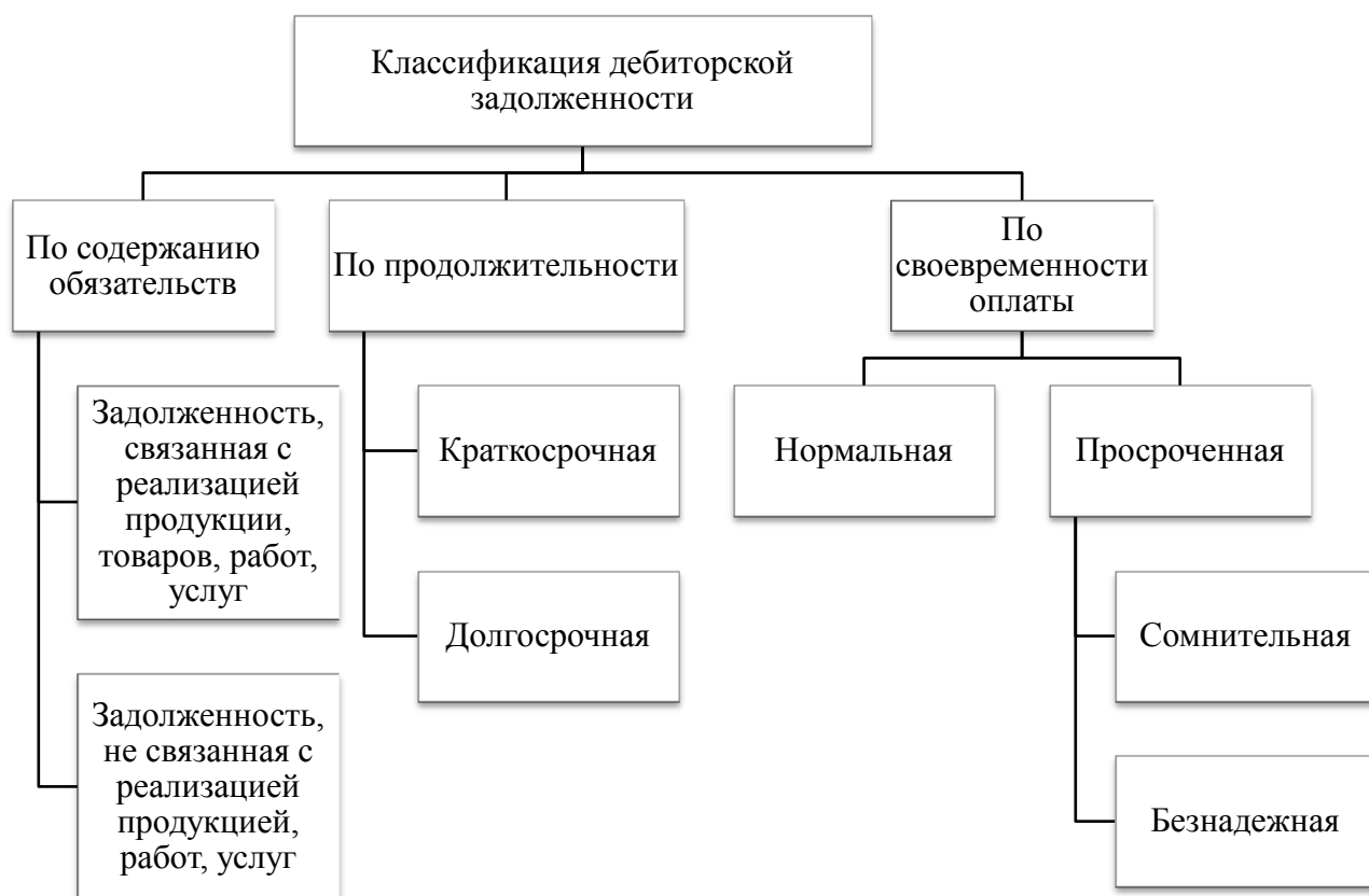
Рисунок 1 - Классификация дебиторской задолженности

Для раскрытия экономической природы кредиторской задолженности требуется изучить ее виды по признакам классификации рисунок 2.