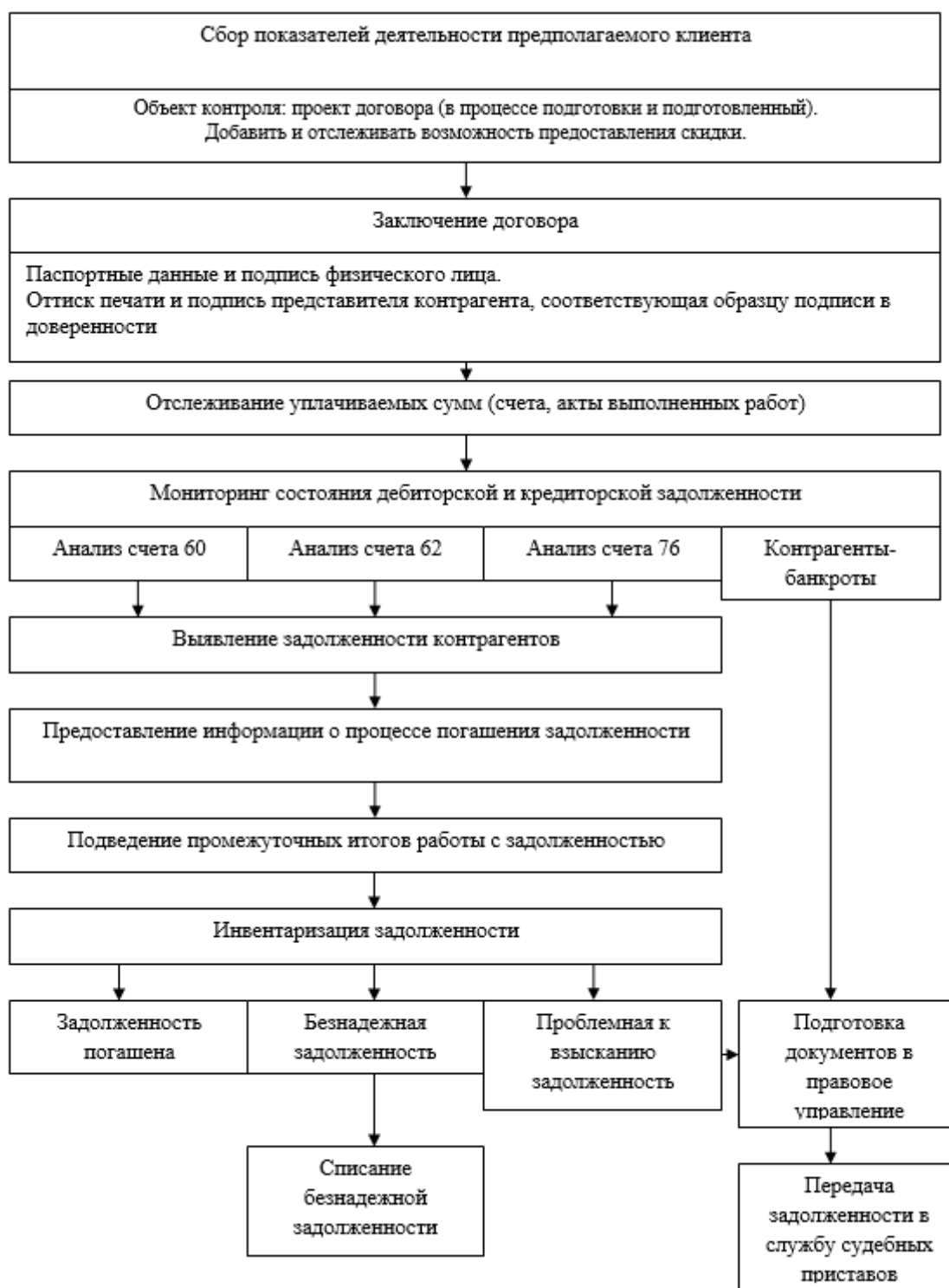
Рисунок 4 - Предлагаемая система внутреннего контроля в ООО «Вектор»

За осуществление внутреннего контроля в ООО «Вектор» отвечает главный бухгалтер. Для успеха в функционировании подсистемы внутреннего контроля на предприятии должна быть налажена работа информационной