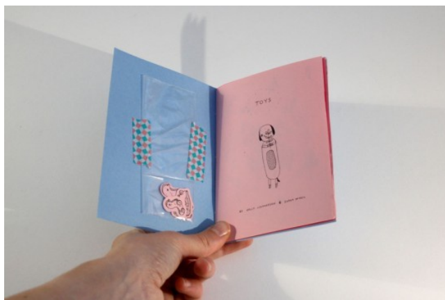
Fig. 9 : Toys , Sarah Mc Neil & Holly Leonardson

Comme l'illustre le fanzine présenté ci-dessus (fig. 9), l'utilisation du ruban adhésif ou de colles contribue également à la détérioration naturelle des documents. Les fanzines demandent donc, dans l'idéal, des conditions de conservation semblables à celles en vigueur dans les magasins patrimoniaux. De nouvelles perspectives s'ouvrent également avec la possibilité de numériser les fanzines 94 . La question se pose alors de leur accès en ligne vis-à-vis de la législation relative à la propriété intellectuelle. Presque tous les fanzines en effet ont été réalisés par des auteurs et artistes contemporains pour lesquels les droits s'appliquent pleinement, par défaut. Selon leurs moyens, la nature et l'objectif de leur collection, les établissements ont développé des stratégies diverses.