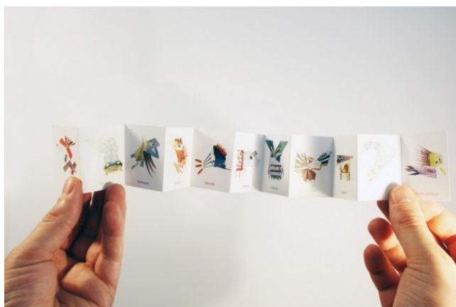
Fig. 8 : Bestiaire d'animos architekturhauts, M et I pour les petits

Les fanzines présentent des caractéristiques physiques très diverses. Ils se singularisent par la variété de leurs supports, de leurs taille et des techniques utilisées pour leur fabrication. De plus, certains fanzines sont accompagnés d'objets tels que badges, autocollants, bonbons 93 . Parfois, ils sont augmentés d'un CD. Les matériaux de base peuvent être aussi divers que le papier peint, le papier craft, la toile, le tissu. La médiathèque Marguerite Duras conserve un fanzine présenté dans une boîte en carton, un autre au format accordéon et même un bocal dans lequel se trouvent des bandes de papier où sont inscrits les vers d'un poème. À la BnF, les techniques représentées sont la sérigraphie, l'impression offset, la photocopie, la linogravure et plus rarement la taille-douce. Ces particularités en font des objets qui défient la conservation. La description physique du fanzine, de son dispositif et de ses pièces jointes éventuelles est très importante pour conserver une image du document au fil du temps et des dégradations auxquelles il est exposé afin de pouvoir le restaurer au besoin.