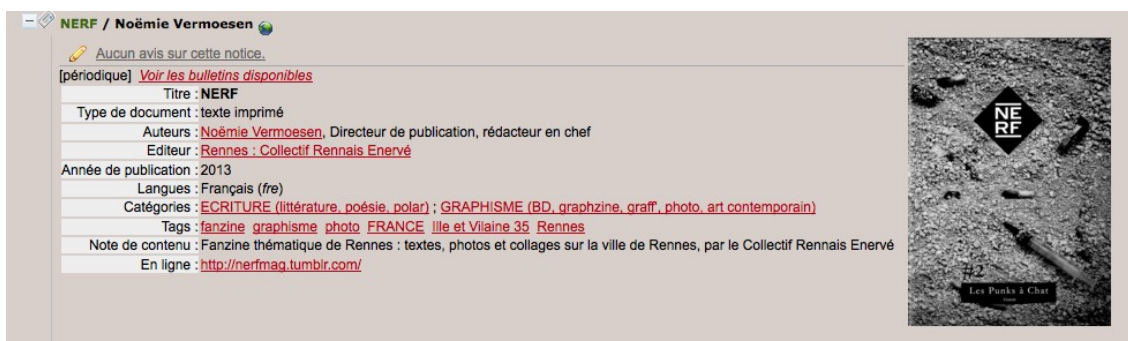
Fig. 5 : Notice de fanzine dans le catalogue de la Fanzinothèque de Poitiers