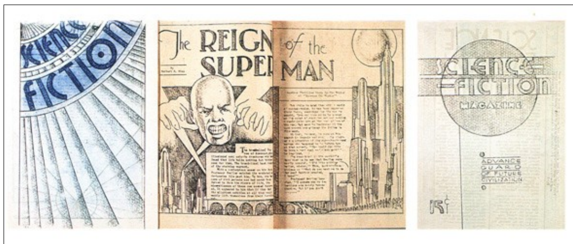
Fig. 1 : Fanzine de SF par Jerry Siegel et Joe Shuster. Première apparition de Superman, 1933

Après la SF, ces publications se multiplient aussi autour de la BD, du polar ou de la poésie dans les années 50 et jusque dans les années 1970. Lors de sa création en 1970 par Jacques Glénat, par exemple, Schtroumpf n'est qu'un fanzine parmi d'autres. En 1932, Jerome Siegel et Joe Schuster publient cinq numéros de leur fanzine Science Fiction . Dans le troisième numéro ils créent Superman, que l'on retrouvera en couverture des D.C.'s Action Comics six ans plus tard.