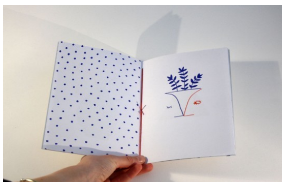
Fig. 13 : Extrait de Visages , par Steffie Brocoli

d'entrer dans ces cadavres exquis et d'y trouver ce qui l'accrochera, ce qui fera sens pour lui. Dans d'autres fanzines, le dessin est préféré. D'aspect parfois naïf, il peut dissimuler une réflexion sur les formes, sur les couleurs, comme c'est le cas pour Visages (fig. 13) 152 . Le graphisme interpelle les lecteurs, engage à « voir autrement », joue avec les codes, comme c'est le cas des coloriages décalés publiés par yvette et paulette 153 , qui proposent un Mondrian DIY ou un Colorie tes grands-mères . En cultivant l'art du montage et de l'interaction, mêlé d'humour, le graphzine déjoue les images et invite les lecteurs à une réflexion active. Lors d'un atelier organisé aux Champs Libres de Rennes 154 , dans le cadre de l'opération nationale Les Portes du temps 155 , les adolescentes participantes ont eu l'occasion de réaliser collectivement un fanzine sur le thème de l'immigration, accompagnée par une association d'artistes sérigraphes. Présenté sous la forme d'un bateau en papier à plier soi-même, l'objet final permet par la manipulation de s'appropriier et de mettre en scène les témoignages recueillis, de s'essayer à de nouvelles techniques graphiques, comme la sérigraphie et d'envisager un autre mode de lecture et de diffusion de l'imprimé.