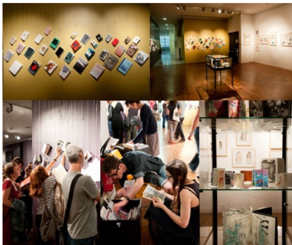
Fig. 12 : Festival Fanzines ! à la médiathèque Marguerite Duras

Pendant la durée du festival Fanzines !, les vitrines et les suspensions, aux murs comme au bout de ficelle, et l'utilisation de spots de lumière sont à l'image des installations dans les galeries d'art contemporain. La volonté exprimée est d'affirmer l'appartenance des fanzines au domaine artistique. La présence de bacs bas, mobilier habituellement destiné aux espaces petite enfance, disposés de façon à organiser de petits coins de lecture, suscite des postures régressives qui soulignent quant à elles la fantaisie des fanzines et de leur univers. Le reste de l'année, des fanzines de petit format sont disséminés dans la médiathèque, les autres sont installés sur un mobilier, jugé inadapté par l'équipe. Ces étagères sont placées dans la continuité de celles accueillant les BD et sur un trajet qui mène à la collection d'art contemporain. À la suite de la réunion de bilan de l'édition 2012 du festival Fanzines !, une discussion a été engagée quant à l'avenir de la collection 124 . Parmi les solutions envisagées, figurent l'idée d'aménager un salon de lecture temporaire ou permanent, déposer des boîtes pour présenter les fanzines de petit format sur les banques de prêt ou encore de créer un mobilier spécifique. Faute de moyens, ces options restent à l'étude.