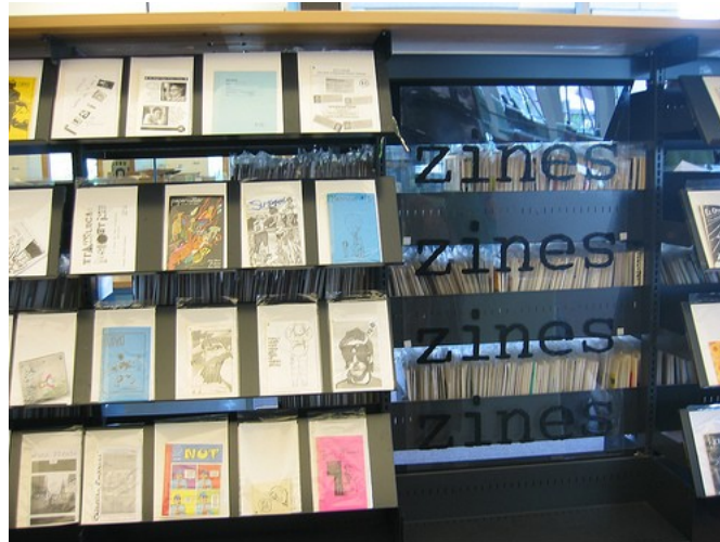
Fig. 11 : L'espace zines de la Salt Lake City Public Library

Le dispositif et le mobilier semblables à ceux des salons de presse tendent à légitimer le fanzine. Un estampillage particulier identifie dans la collection les fanzines locaux. La bibliothèque affiche clairement son soutien à l'édition indépendante et son attachement à l'expression et la représentation des membres de sa communauté. Elle encourage et incite à la curiosité et à la découverte des fanzines.