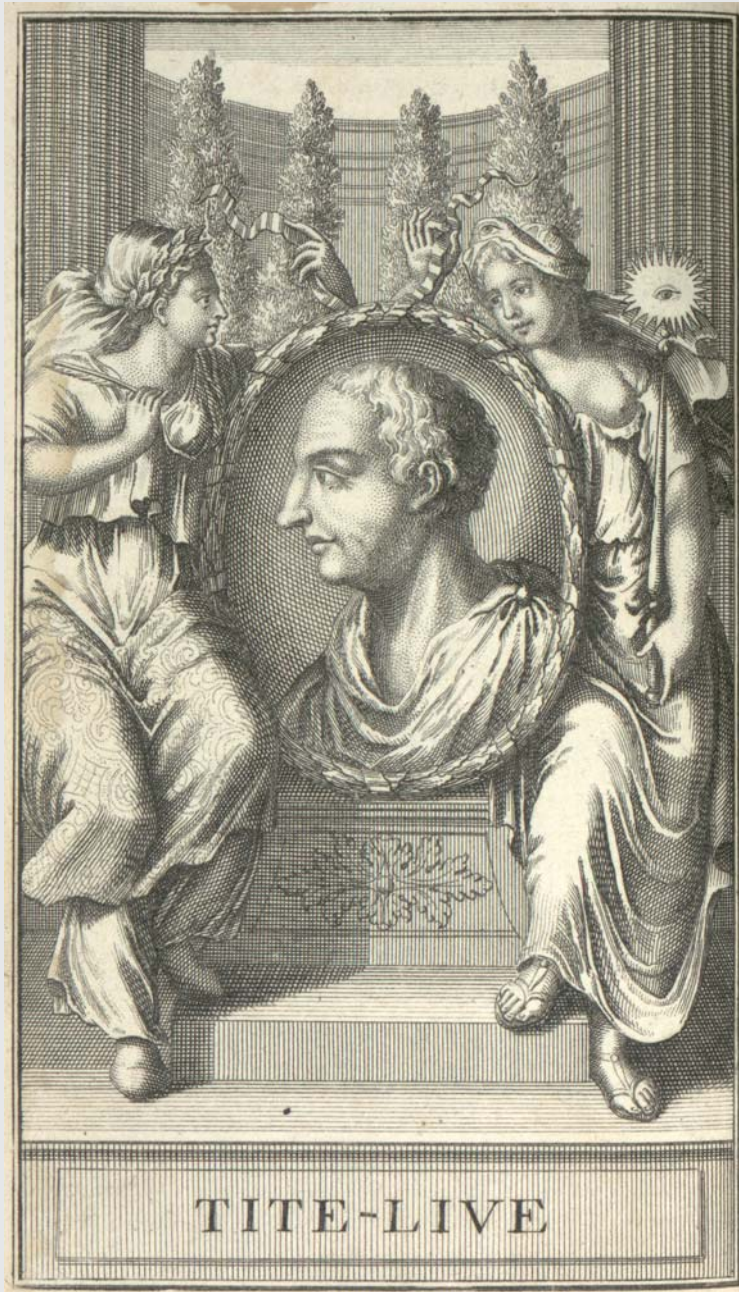
Portrait de Tite-Live issu de : Les Décades de Tite-Live. Tome I. Amsterdam, 1722