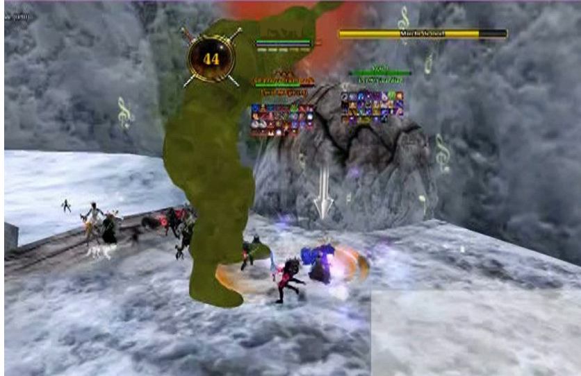
Figure 4. Les Tanks attirent les coups du monstre ( mob )

Cette activité dépend d'une logique liée aux caractéristiques de ces personnages (résistance) mais surtout à la complémentarité de leur rôle avec d'autres personnages qu'ils doivent « protéger ».