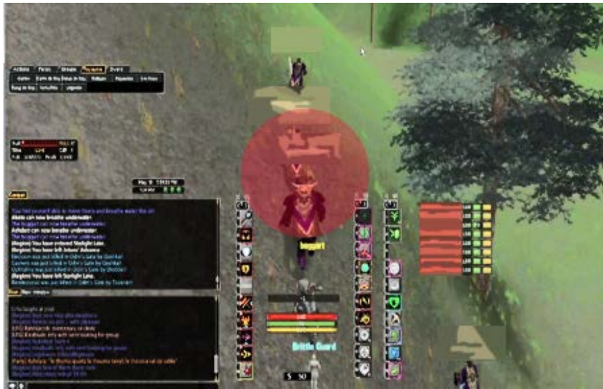
Figure 5. Un joueur « Tank » a placé ses barres d'action de manière centrale pour pouvoir cliquer dessus rapidement

Un healer (soigneur) va quant à lui disposer la fenêtre de son groupe de manière visible et souvent en mode « avancé » afin de pouvoir observer attentivement les barres de vie et les effets négatifs subis par ses co-équipiers (cf. figure 6).