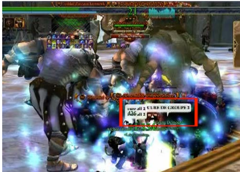
Figure 7. Les joueurs communiquent certaines actions de leur personnage 15 qui sont importantes dans la séquence construite avec les autres joueurs

Au niveau conversationnel, les messages échangés témoignent d'une volonté des joueurs de « décrire » certaines actions qu'ils déclenchent ou de « constater » des éléments observés dans l'environnement (mais peut-être pas par tout le monde). Dans un combat coordonné, un joueur