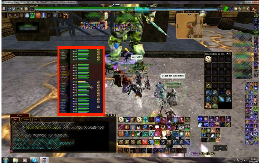
Figure 6. Un soigneur dispose la fenêtre du raid (groupe de joueurs) de manière centrale pour observer les dégâts subis par ses coéquipiers