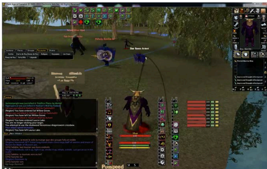
Figure 3. Un Tank va interrompre un personnage ennemi

Dans EverQuest 2 où les joueurs s'associent pour combattre un monstre contrôlé par l'intelligence artificielle du jeu, le Tank a pour fonction d'attirer l'« attention du monstre ». Il vient ensuite se placer au