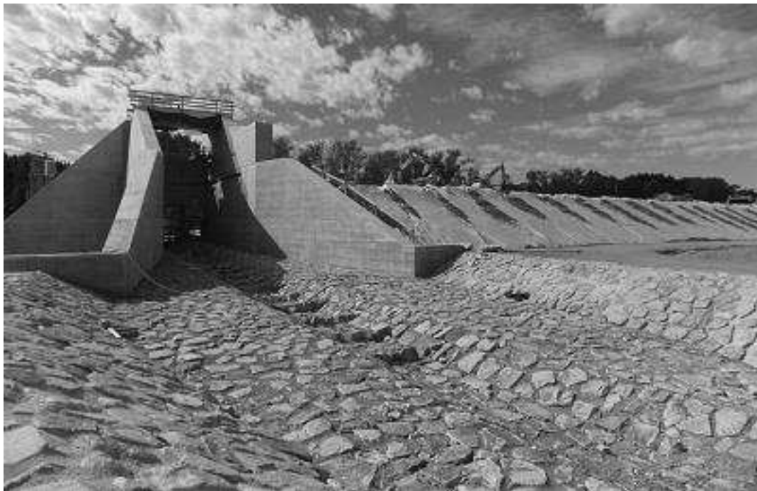
Abbildung 2: Bauzustand HRB Neuwürschnitz, Auslaufbauwerk, Tosmulde, Querriegel (ARGE HPI ARCADIS, 10/2015)

Bereits im Rahmen dieser Neutralisation wurde durch UBB und FSV für die ausgebaute Gewässerstrecke festgestellt, dass damit die gestellten Anforderungen erfüllt und eine hohe Strömungsdiversität erreicht wurde.