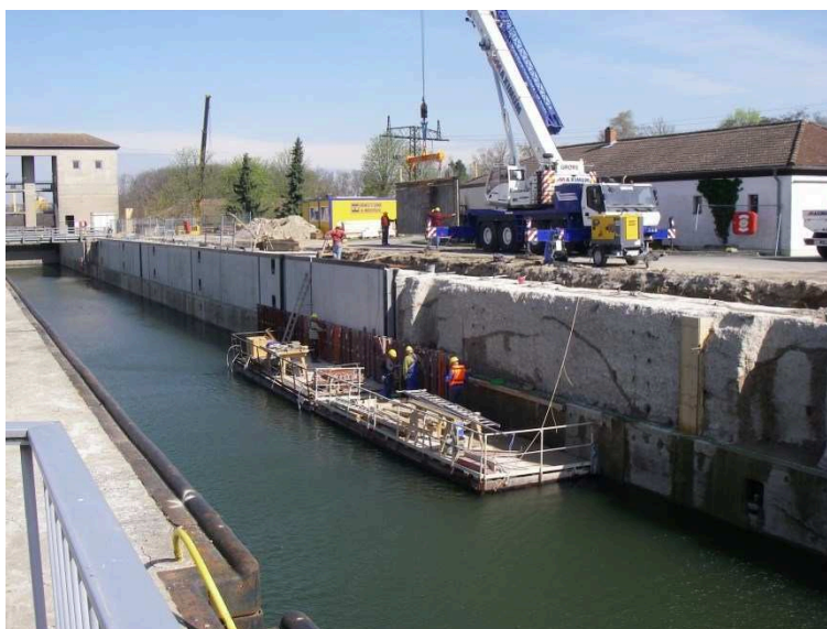
Bild 2: Instandsetzung der Kammerwände der Schleuse Wedtlenstedt mit Fertigteilen unter Betrieb

Eine weitere Instandsetzungsmaßnahme unter Betrieb wurde an der Schleuse Wedtlenstedt realisiert (siehe Bild 2). Hier wurde in den Jahren 2010/2011 der obere Kammerwandbereich auf einer Höhe von etwa 3 m nach vorherigem Betonabtrag mittels Fertigteilen reprofiliert (siehe u. a. Bartel (2011)).