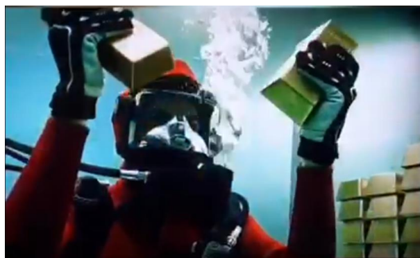
Figura 2. Escena de la Temporada 3 de “La Casa de Papel” (NETFLIX).

Y ya, como el colmo de la “fantasía metalúrgica”, una escena de la 1ª temporada de “Juego de Tronos” 4 , Khal Drogo vacía el caldero de la sopa para introducir en su interior una serie de objetos de oro que se hallan “casualmente” en la tienda de campaña; el caldero, sobre el fuego que hace un momento hacía humear un guiso, pero que ahora, sin más, alcanza una temperatura suficiente como para fundir oro (que, por cierto, funde sin alcanzar el característico aspecto ígneo de cualquier metal durante su fusión). Así, en pocos segundos, en el caldero burbujea un fluido dorado y el protagonista, sin necesidad de protección alguna, vierte su contenido sobre la cabeza de un personaje que finaliza su periplo en la serie en ese momento (Fig. 3). Lo único cierto de toda esta secuencia, es que el personaje “coronado” con el oro líquido, muere. Y que al caer al suelo (tras una solidificación inmediata e impecable del “casco” dorado), hace un ruido metálico (“¡clonc!”) característico. ¡Por favor, que nadie pruebe a hacer esto en su casa!