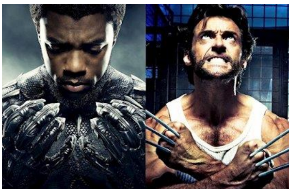
Figura 6. Vibranium de la armadura de Black Panther (izquierda) y Adamantium de las garras de Lobezno (derecha) 6 .