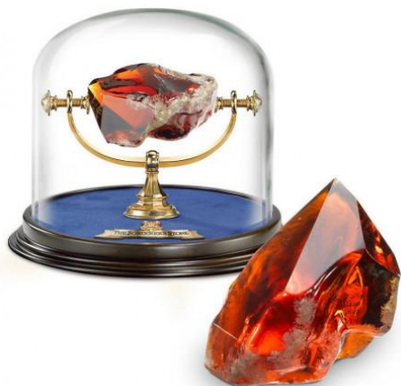
Figura 1. Piedra Filosofal de la película “Harry Potter y la Piedra Filosofal”.