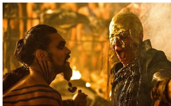
Figura 3. Escena de la Temporada 1 de “Juego de Tronos” (HBO).