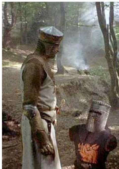
Figura 5. “El caballero negro”, escena de Monty Python en “Los Caballeros de la Mesa Cuadrada y sus Locos Seguidores”.