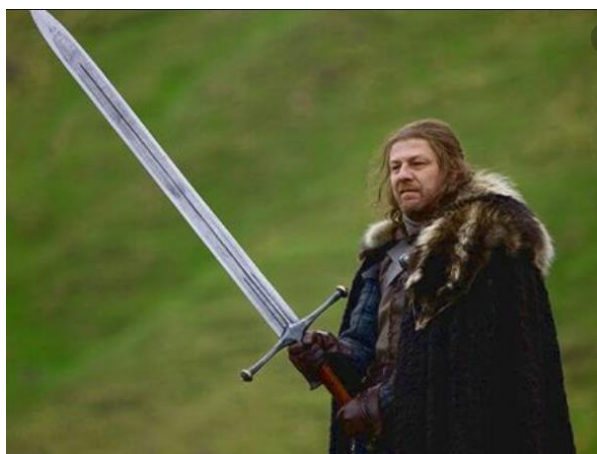
Figura 4. Escena de la Temporada 1 de “Juego de Tronos” (HBO).