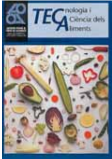
Número 0 Desembre 1996 80 pàgines

Aquells de vosaltres que no heu pogut gaudir amb els números 0, 1, 2 i 3 de la revista TECA, ara teniu l'oportunitat de fer-ho. Us els oferim per un preu realment atractiu, només 3.000 pessetes. Truqueu al 932 701 620 perquè us puguem oferir més informació sobre aquesta magnífica oferta.