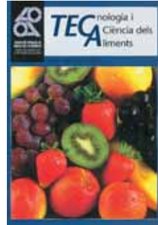
Número 2 Juliol 1998 88 pàgines