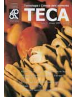
Número 3 Gener 1999 76 pàgines