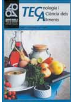
Número 1 Novembre 1997 84 pàgines