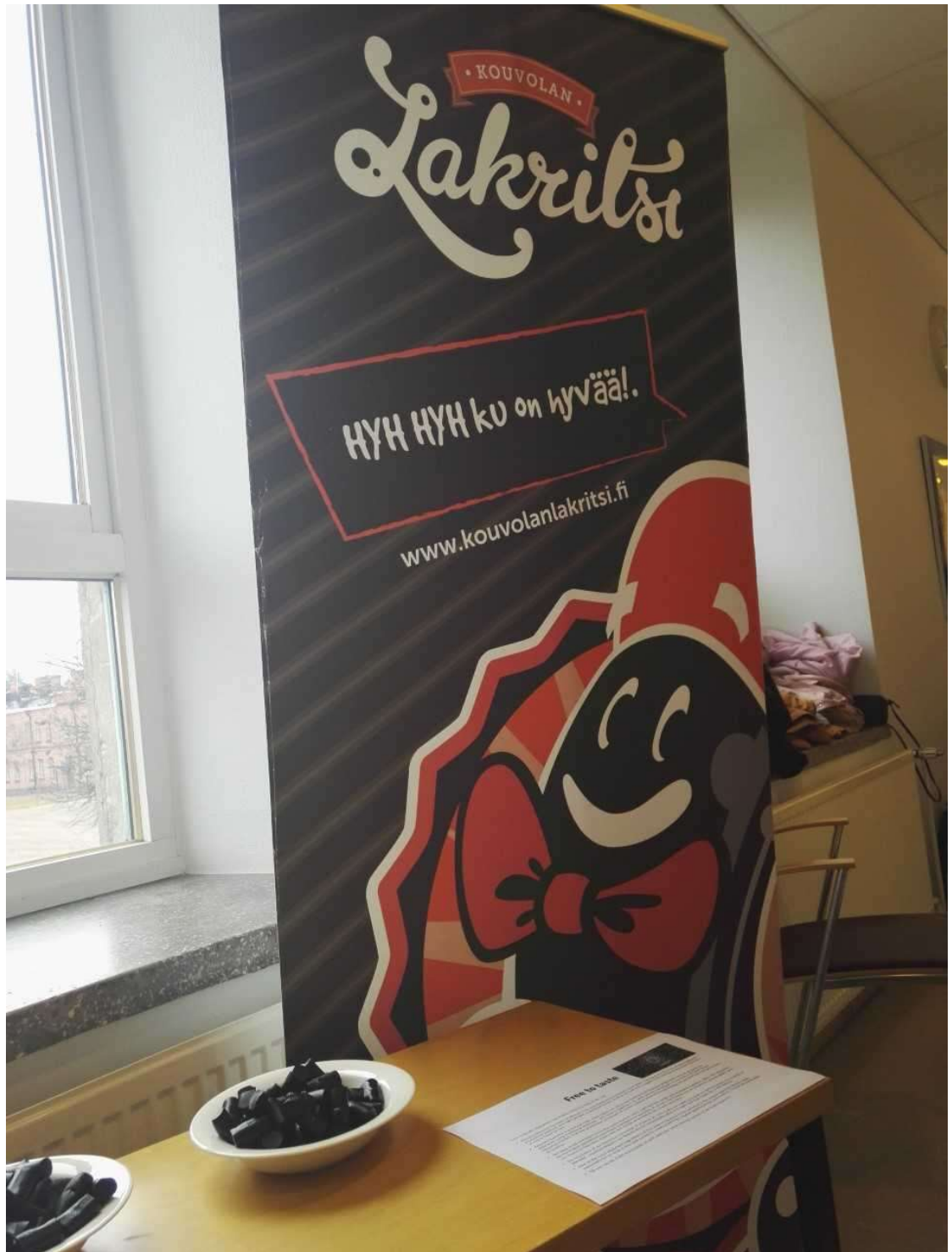
Kuva 2. Kouvolan lakritsin maistiaiset. (Kuusisto 2017)

Muutamien kokousten päästä tapahtuma alkoikin jo hahmottua ja itsellenikin tuli uusi ja konkreettisempi tehtävä itse tapahtumajärjestämiseen: sain vastatakseni ja vastuukseni IW:n suosituimman yleisötapahtuman, eli Food Tasting:in koordinoimisen. Aloitin työni esittäytymällä IB17-ryhmäläisille kasvotusten heidän tuntinsa alussa ja antamalla helle yhteystietoni. Valitettavasti kukaan ryhmistä ei tarttunut esittämäni mahdollisuuteen eikä ottanut yhteyttä minuun. Seuraava yhteydenmuodostusyritys oli se, että tulostin koulullamme