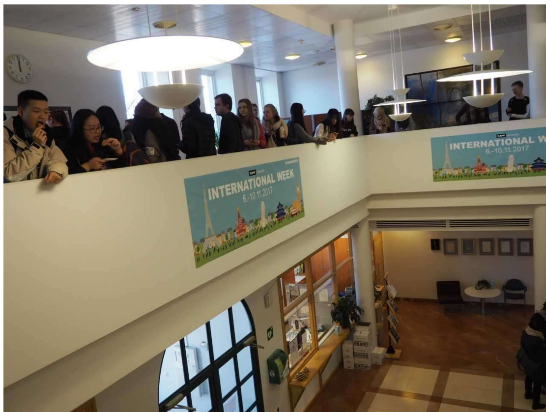
Kuva 4. Food Tasting aulan 2. kerroksessa. 1.kerroksessa tanssi-workshop. (Kuusisto 2017)

Uusi tapahtumapaikkakaan ei moitteilta säästynyt. Maa-ryhmien haastattelussa tulivat esille sellaiset seikat, kun liian kapeat käytävät, liian paljon melua ja tanssiesitykset eivät näkyneet hyvin. Kaikkia näitä seikkoja ei ratkaistu, mutta joitakin parannus ja kehitysideoita opiskelijoilta sain. Ensinnäkin kokonaan eri tapahtumapaikka, kuten mahdollisuuksien mukaan Paja-ravintola tai Meduusa-studio. Ryhmät ehdottivat myös luokahuoneiden käyttöä Food Tasting:issä; luokat voisivat olla jopa jaettu teeman tai vaikkapa maanosan mukaan ja niissä voisi olla ruokatarjoilun muassa muutakin esityksiä ja ohjelmaa.