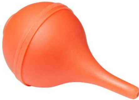
Kuva 3. Havainnointi kuva korvapumpusta

Korvahuuhtelu tekstin kohdille on lisätty kuva korvapumpusta (kuva 3). ohjeen alaosassa on suositus, jos korvaoireet eivät lähde huuhtelulla, tulee hakeutua omalle terveysasemalle.