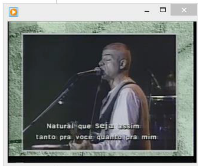
Figura 3 – Trecho da letra em que o presente do subjuntivo do verbo “ser” foi usado de acordo com a norma padrão.

Após a apresentação do vídeo de Lulu Santos, o professor Pasquale faz uma observação (que diz respeito à exceção às regras discutidas no decorrer do programa). De acordo com ele, o verbo “estar” seria o único que não se encaixaria nessas regras, visto que, embora seja um verbo de primeira conjugação (terminado em – AR), a forma do verbo conjugada no presente do subjuntivo terminaria em “A” 6 .