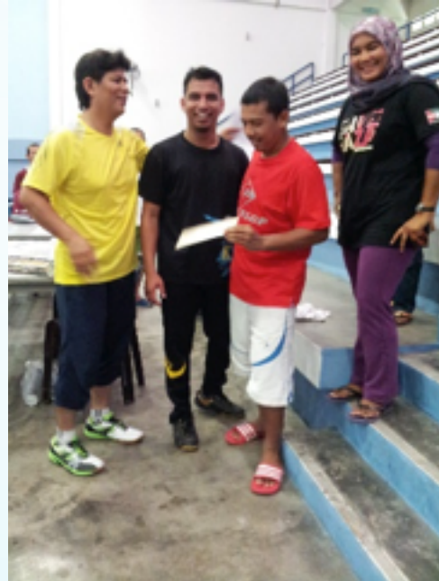
Johan dan Naib Johan Pertandingan Badminton