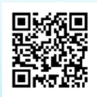
Latar Belakang Penulis Pertama: