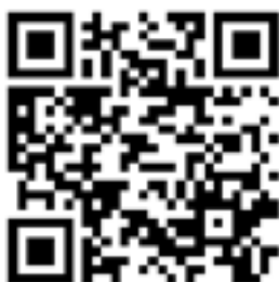
Latar Belakang Penulis Pertama: