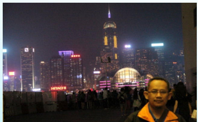
Pemandangan waktu malam di belakang bangunan Hong Kong Museum of Art