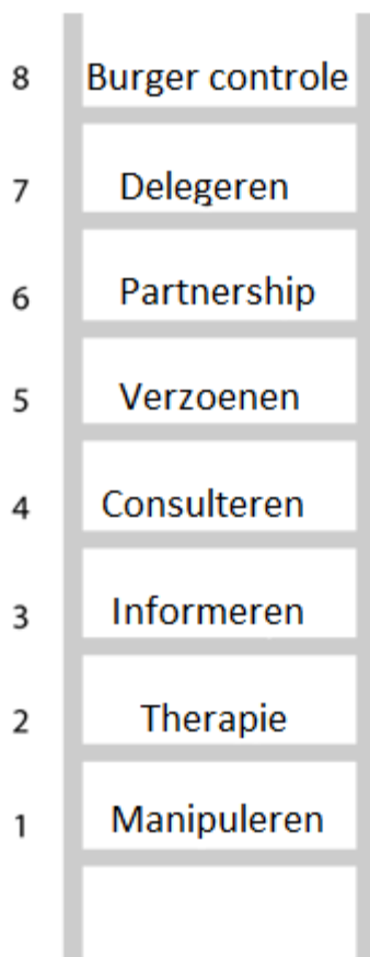
Arnstein's Ladder (1969) Degrees of Citizen Participation

De Ladder van participatie biedt handvatten om verschillende vormen van participatie te duiden en vooraf na te denken over welke vorm van participatie het best past bij de geformuleerde doelstellingen. Hierbij is het nadrukkelijk NIET zo dat de hoogste trede van de ladder ook de “beste” of meest nastrevenswaardige trede is. Daarom wordt de ladder ook soms weergegeven als een wiel. Het antwoord op de vraag wat de beste trede/ vorm van participatie is, hangt altijd af van de context en het na te streven doel. Men dient wel altijd open, transparant en eerlijk te zijn over de mate waarin belanghebbenden invloed (kunnen) hebben op het proces en/ of de uitkomsten van het proces.