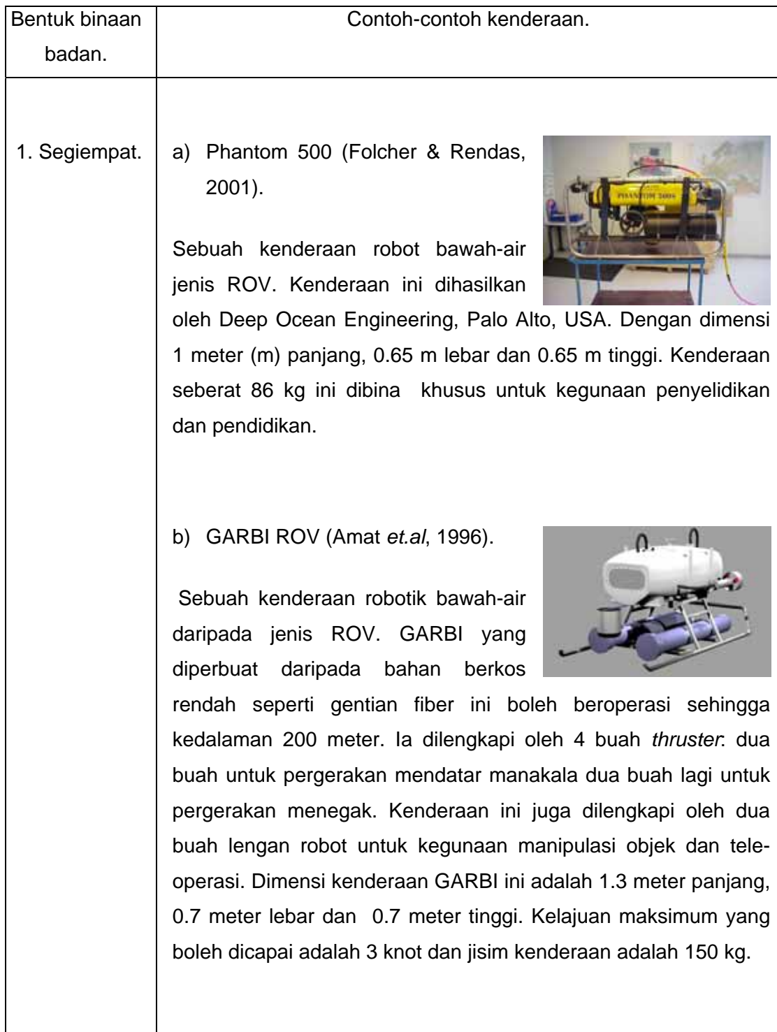
Jadual 2.2: Contoh-Contoh Bentuk Binaan Badan Kenderaan Robotik Bawah-Air.