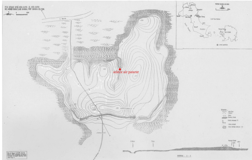
Gambar 1. Peta Situs Kota Kapur dan Sektor Air Pancur (insert: Peta Pulau Bangka)

perbukitan. Di bagian barat pulau inilah Situs Kota Kapur berada. Kondisi lingkungannya berupa dataran dan berhadapan langsung dengan Selat Bangka di bagian utara. Di sebelah barat, dan timur situs masih tertutup oleh hutan mangrove. Di sebelah selatan, kontur tanahnya agak berbukit-bukit dan kini menjadi tempat yang cocok untuk tanaman karet ( Havea brasiliensis ) dan lada ( Piper nigrum ). Wilayah paling tinggi di sebelah selatan situs dikenal sebagai Bukit Besar yang memiliki sekitar \pm 125 meter di atas permukaan laut (d.p.l.) Situs Kota Kapur juga dilintasi oleh sejumlah sungai kecil yang kemudian bertemu dengan Sungai Mendo (Menduk) dan akhirnya bermuara di Selat Bangka (Gambar1) (Tim Peneliti 2013).