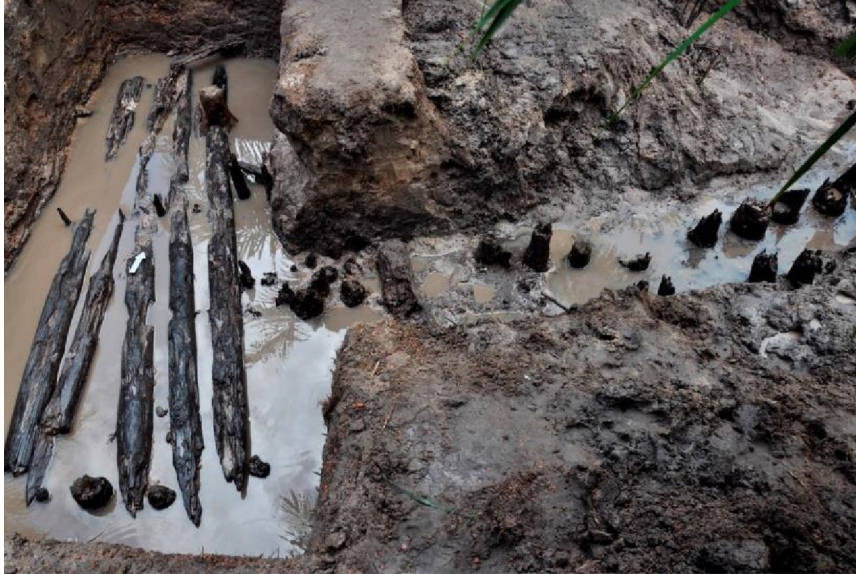
Gambar 4. Sisa dermaga dari sisi tenggara (tampak samping)

tali ijuk yang ditemukan di gelondongan kayu pelangas. Tali ijuk yang digunakan berasal dari jenis pohon enau yang diambil bagian selubung daun mudanya dan berwarna hitam. Ijuk biasa digunakan untuk mengikat dan biasa ditemukan pada perahu-perahu kuna di Nusantara. Untuk dapat digunakan sebagai tali maka ijuk yang baru diambil dari pohonnya perlu dirapihkan dan kemudian dianyam menjadi tali.