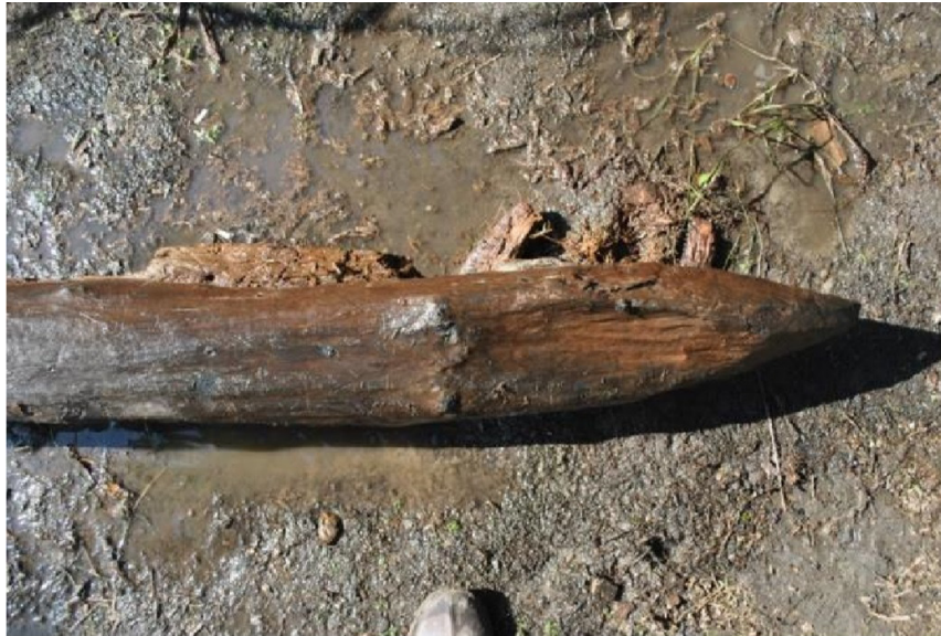
Gambar 3. Lancipan pada salah satu batang yang digunakan untuk menancapkan tiang)

Deretan tiang-tiang yang ditemukan jelas sekali dibuat oleh manusia karena dari satu tiang yang terlepas diketahui ada jejak pangkasan pada salah satu ujung tiangnya (Gambar 3).