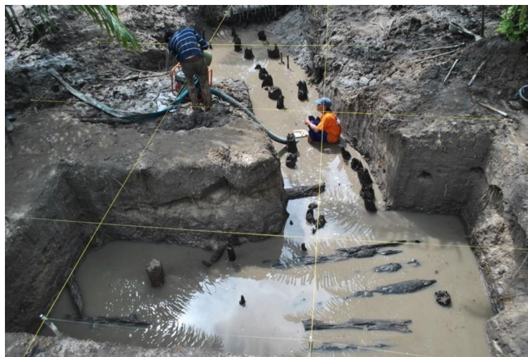
Gambar 2. Temuan sisa tiang dermaga

Hasil penggalian memperlihatkan bahwa sampai kedalaman 100 cm adalah lapisan lempung pasir dan diikuti oleh lapisan tanah gambut yang berwarna hitam pada lapisan lempung berwarna hitam yang diselingi oleh dedaunan dan sisa kayu. Temuan sisa tiang mulai muncul pada kedalaman 110 – 140 cm (Gambar 2).