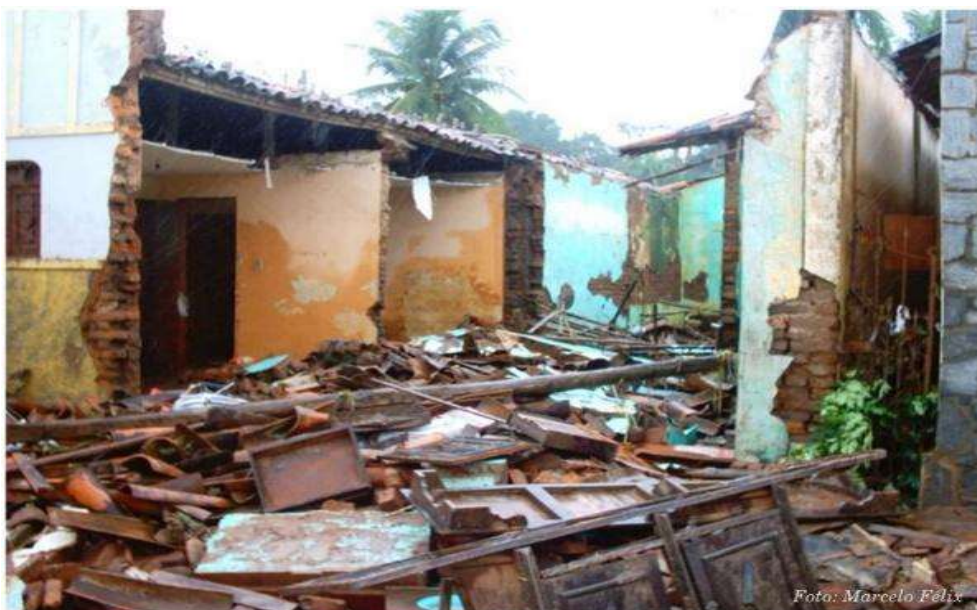
Figura 8. Fotografia de uma das residências que foram totalmente danificadas.

Fonte: Blog do Cassimiro/ Fotografia de: Marcelo Félix. Ano (2016)