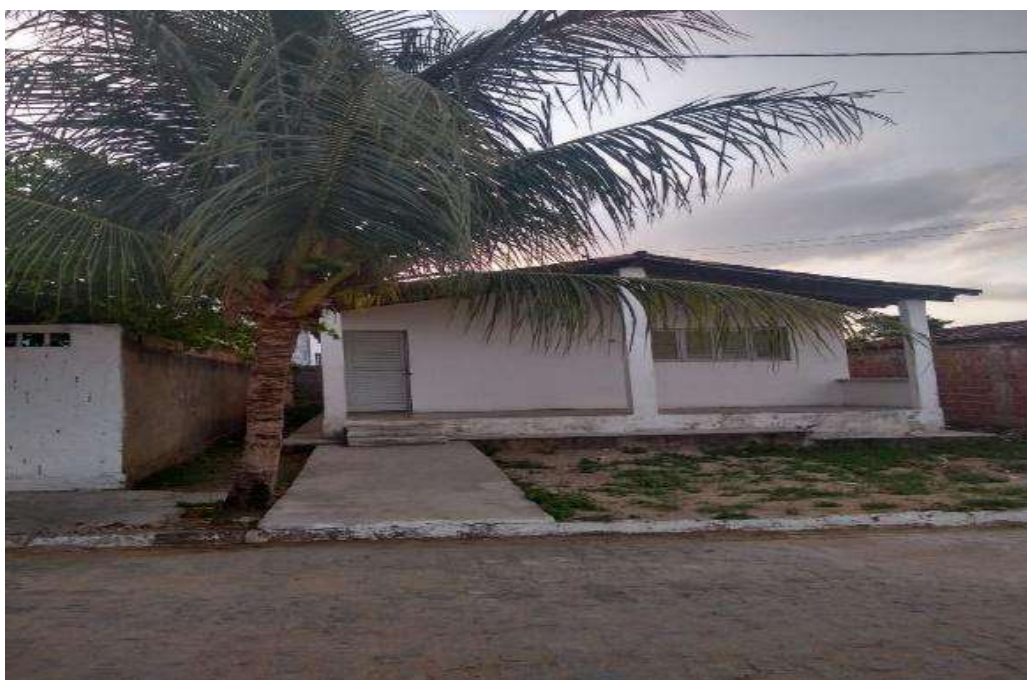
Figura 13. Fotografia do modelo de residência padrão no Conjunto Habitacional do Camará.

Em diálogo com um morador da área, o mesmo afirma que algumas pessoas que tiveram direito a receber as residências nem mesmo necessitavam delas e muitos acabaram se beneficiando do imóvel, mas com o passar do tempo as vendiam e retornavam para as suas casas de origem. O crescimento urbano e a valorização dos mesmos facilitavam os repasses das casas para diferentes moradores, que adquiriram os imóveis e reconstruíram as casas em várias áreas do conjunto.