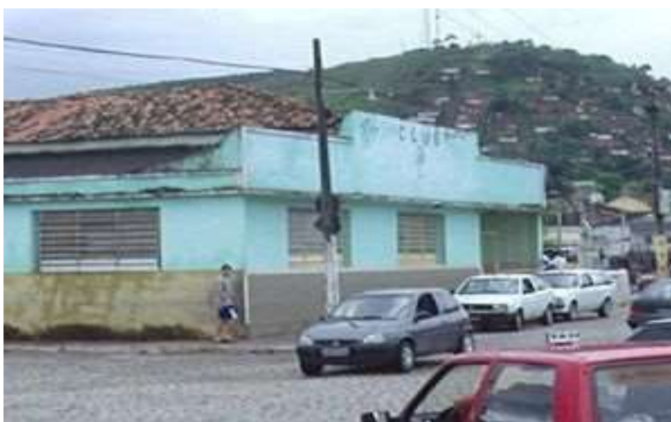
Figura 15: Imagem do Clube 31 localizado no centro da cidade.