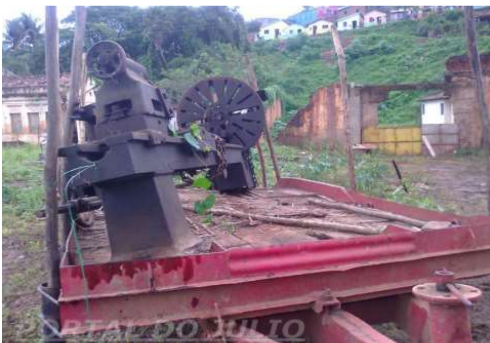
Figura 22. Fotografia de um dos instrumentos da oficina que ainda permanecia no local, após o rompimento da barragem.

Após o rompimento da barragem, a oficina passou muitos tempo demolida, e alguns dos seus instrumentos e maquinários que permaneceram no local, segundo a matéria gerada no Blog do Cristiano Alves "Alagoinha em Foco", foram removidas no dia 03 de Julho de 2012 e levadas ao depósito do seu atual dono.