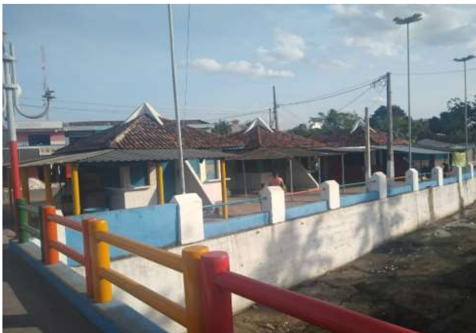
Figura 16: Fotografia de alguns dos quiosques que foram reconstruídos nas margens da lagoa no centro da cidade.

Atualmente, o espaço possui vários quiosques, que ao serem construídos pela prefeitura, foram repassados aos pequenos comerciantes que existiam por trás do clube, como forma de ressarcir sua perda com o alagamento da área. O local que antes era principalmente de recreação, hoje funciona espaço de consumo pelo comércio de barzinhos e pequenas lanchonetes, onde se encontra normalmente muito frequentado, principalmente aos fins de semana, chamando a atenção dos diferentes públicos e principalmente turistas, por sua localização valorizar a vista dos principais pontos turísticos da cidade, que são a Lagoa do Paó e o Cruzeiro, localizados na parte alta do morro.