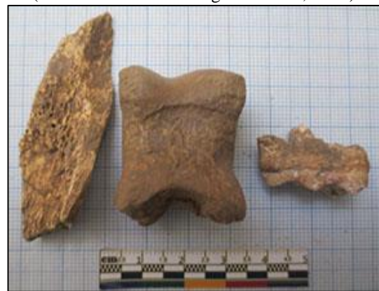
Gambar 7. Temuan fragmen tulang dan gigi di Loko Maliling.