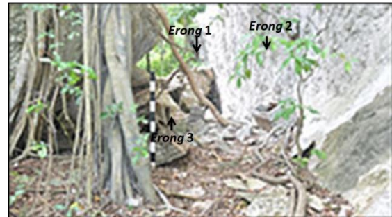
Gambar 1. Letak ketiga wadah kubur kayu ( erong ) di Leang Kalidong, Enrekang.