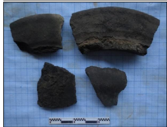
Gambar 10. Lumpang batu dan fragmen tembikar yang ditemukan di puncak Gunung