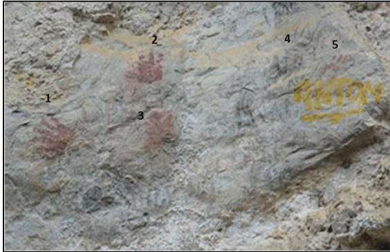
Gambar 4. Cap tangan di dinding tebing di Desa Lunjen, Buntu Batu, Enrekang.

Situs ini terletak di Desa Lunjen, Kecamatan Buntu Batu, Kabupaten Enrekang dengan posisi koordinat 03^{\circ} 25' 39,2'' LS dan 119^{\circ} 52' 39,3'' BT dengan ketinggian 832 meter dari permukaan laut. Aksesibilitas situs ini cukup sulit karena terletak di atas gunung, sehingga untuk mencapainya harus berjalan kaki melalui lereng-lereng bukit. Situs ini merupakan situs dengan tebing batu. Secara geografis, situs ini terletak pada tebing batu yang memiliki ketinggian sekitar 30 meter. Keadaan permukaan tanah cukup padat berwarna kuning keabu-abuan. Lantai depan agak lebar dan rata memanjang ke arah timur. Bongkahan batu gamping besar berada pada sisi kiri dan kanan jalan pelataran.