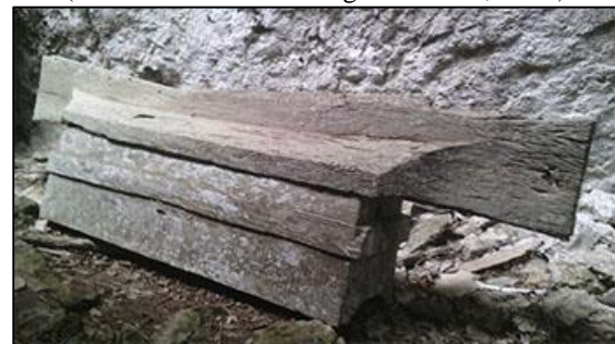
Gambar 2. Bentuk wadah kubur kayu ( erong ) No. 1 di Leang Kalidong, Enrekang.