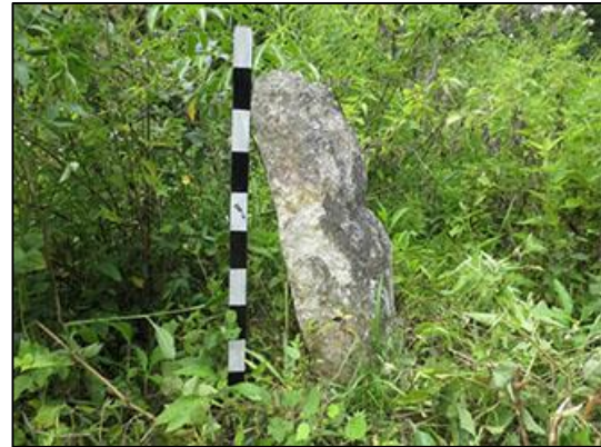
Gambar 8. Menhir yang digunakan sebagai tempat mengikat kerbau

dilakukan tidak menentu waktunya, dan terkadang dilakukan dalam lima atau enam tahun sekali dan jumlah kerbau yang dipotong hanya satu ekor (Hasanuddin, 2015).