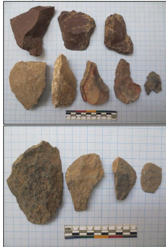
Gambar 6. Temuan serpih (atas) dan limbah hasil produksi (bawah) di Loko Maliling.

dibuktikan dengan temuan limbah sebagai sisa produksi pembuatan artefak.