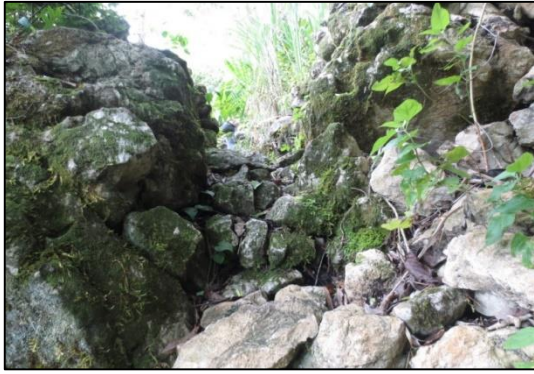
Gambar 9. Salah satu pintu gerbang yang harus dilalui sebelum mencapai puncak Buntu Marari.

Indikasi permukiman, yaitu ditemukan di atas puncak gunung, permukaan tanah yang datar, dengan struktur batu yang dijadikan sebagai teras untuk menahan tanah agar tidak mudah runtuh. Selain itu, ditemukan pula dua lumpang batu, satu altar, fragmen tulang binatang dan 43 fragmen tembikar yang tersebar secara merata di atas puncak. Sebagian besar dari temuan fragmen tembikar tersebut memiliki sisa arang pada permukaan bagian luarnya sebagai indikasi pemakaian untuk memasak bahan makanan. Demikian pula dengan kedua lumpang batu yang ditemukan semuanya mempunyai permukaan lubang yang halus sebagai indikasi pemakaian yang berulang. Lumpang batu tersebut digunakan untuk menumbuk biji-bijian.