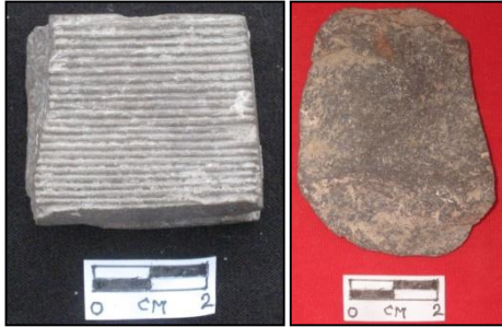
Gambar 11. Batu pemukul kulit kayu dan fragmen beliung

perkebunan, serta lembah Sungai Saddang. Situs tersebut merupakan ceruk dengan temuan artefak batu berupa beliung, batu pemukul kulit kayu yang biasa digunakan untuk pembuatan pakaian, dan fragmen tembikar.