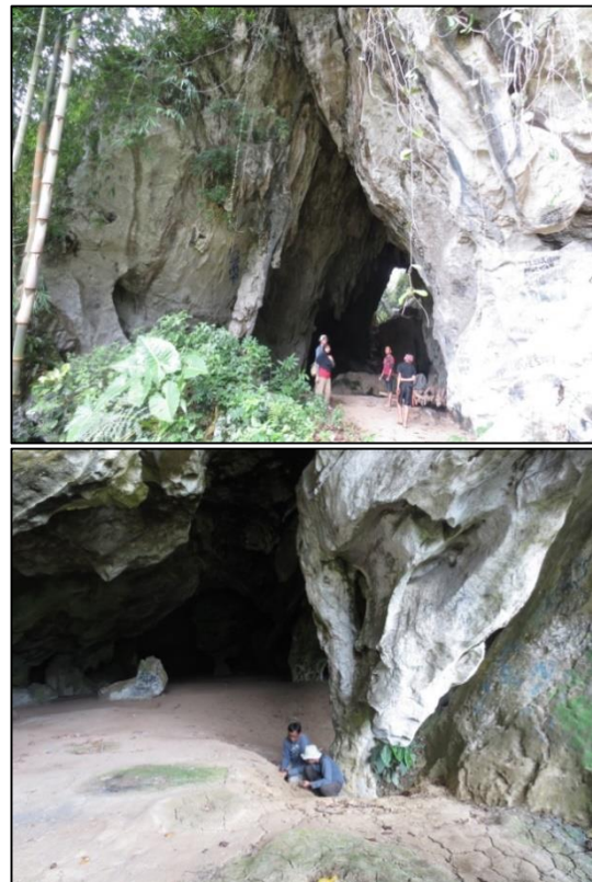
Gambar 5. Ruang Pertama (Atas) dan Ruang Kedua (Bawah) Loko Maliling

Gua ini terdiri atas dua ruang dengan arah hadap ke selatan ( 180^{\circ} ). Lantai ruang pertama adalah tanah padat dengan permukaan yang lebih rendah dibandingkan dengan lantai ruang kedua. Di dalamnya terdapat pilar-pilar hasil pembentukan stalaktit dan stalakmit.