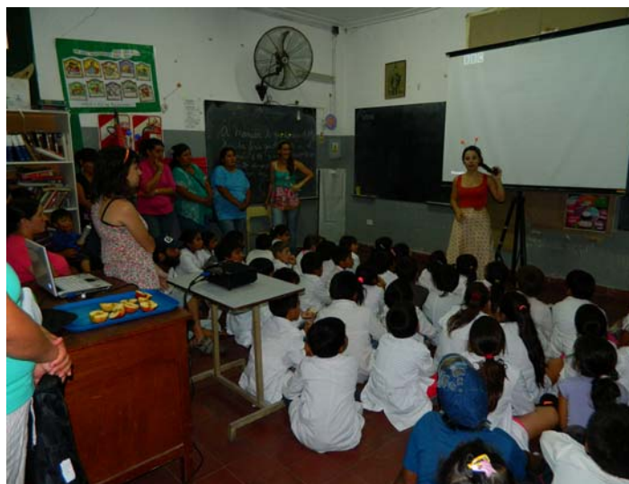
Imagen 2: proyección de material audiovisual