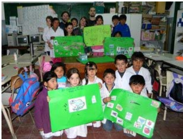
Imagen 1: actividades realizadas en la EEP n° 20, Poblet.

Consideramos que de los talleres propuestos, dos tuvieron mayor éxito e impacto. El primero fue la realización de un mapa social que nos permitió conocer cómo los niños interpretan el ambiente en que viven y los elementos que lo componen. La segunda actividad exitosa fue el armado de un acuario que se mantuvo en las escuelas durante dos meses para que toda la comunidad educativa pudiera visualizar la metamorfosis de los anfibios y, adicionalmente, algunos de los componentes de los cuerpos de agua de la región.