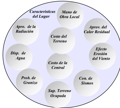
Figura 1. Esquema del Conjunto Difuso de Características del Lugar.

Es por ello que se decidió trabajar con las variables involucradas en forma de conjuntos difusos, ya que el grado de pertenencia que asigne cada subconjunto a los elementos del conjunto, involucra cierto grado de incertidumbre, propias de la variable. En este trabajo, primeramente se definió un conjunto difuso denominado Características del Lugar , este se dividió en diez subconjuntos que citan en el párrafo precedente, y tal como se observa en la figura 1.