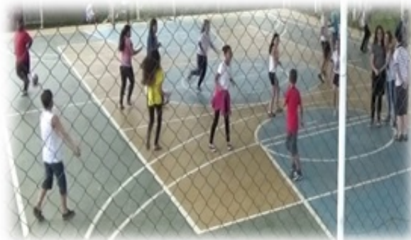
Figura 2 – Interação e mediação os alunos

Ao optarem em abraçar os colegas que tinham maior afinidade, discutiu-se sobre a possibilidade de deixarem um colega na selva para os animais selvagens devorarem, pois esse era o ambiente simbólico estabelecido. Assim, após a intervenção docente acabaram abraçando à todos, independentemente da relação que estabeleciam fora do momento da aula. Logo, houve participação de todos os alunos, tornando o ambiente do jogo, um espaço de alegria, prazer e descontração e convivência social.