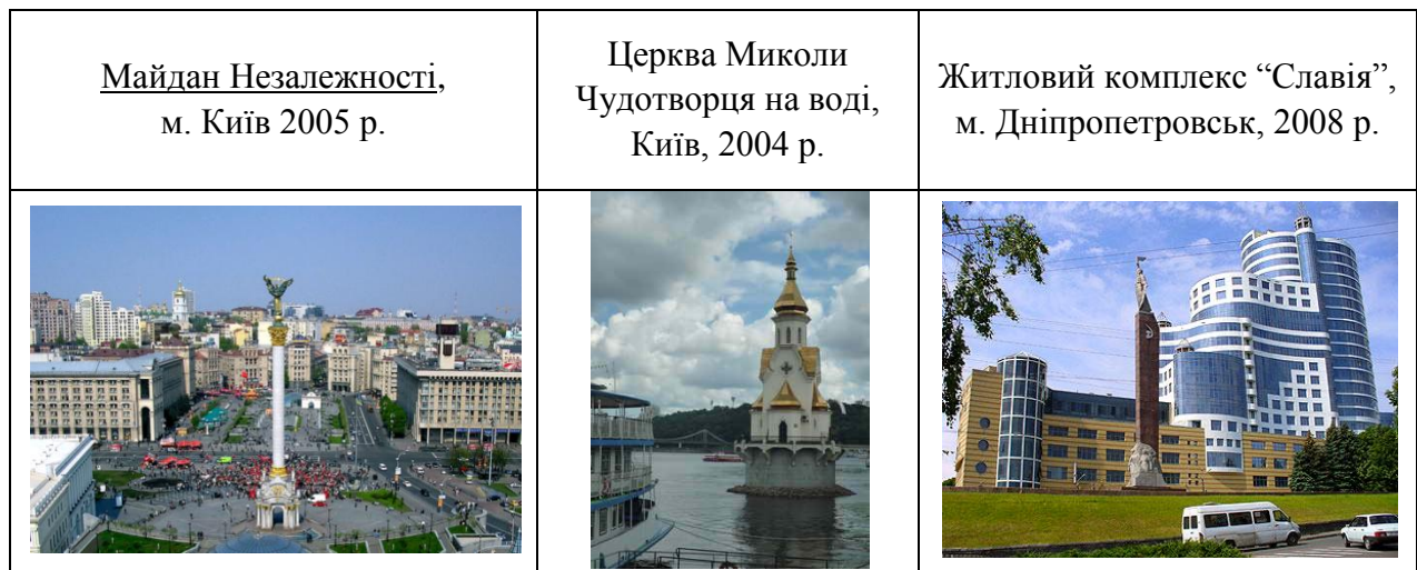
Рис. 5. Сучасна українська архітектура

Основні напрями розвитку сучасної української архітектури визначені осмисленням нових аспектів естетики форми та змісту, що пов'язані з новими соціальними функціями будівель, з новітніми конструктивними, інженерно-технологічними розробками, а також з вирішенням проблем удосконалення основних характеристик архітектурного об'єкту.