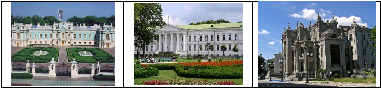
Рис. 4. Вираження художнього змісту та образу у представницьких спорудах різних архітектурних стилів

Основні напрями розвитку сучасної української архітектури визначені осмисленням нових аспектів естетики форми та змісту, що пов'язані з новими соціальними функціями будівель, з новітніми конструктивними, інженерно-технологічними розробками, а також з вирішенням проблем удосконалення основних характеристик архітектурного об'єкту.