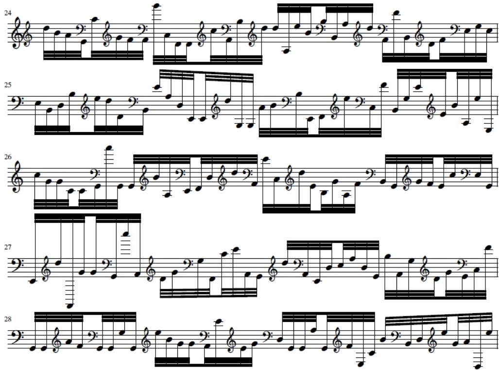
Fig. 4. BACS uniform distribution random music sample