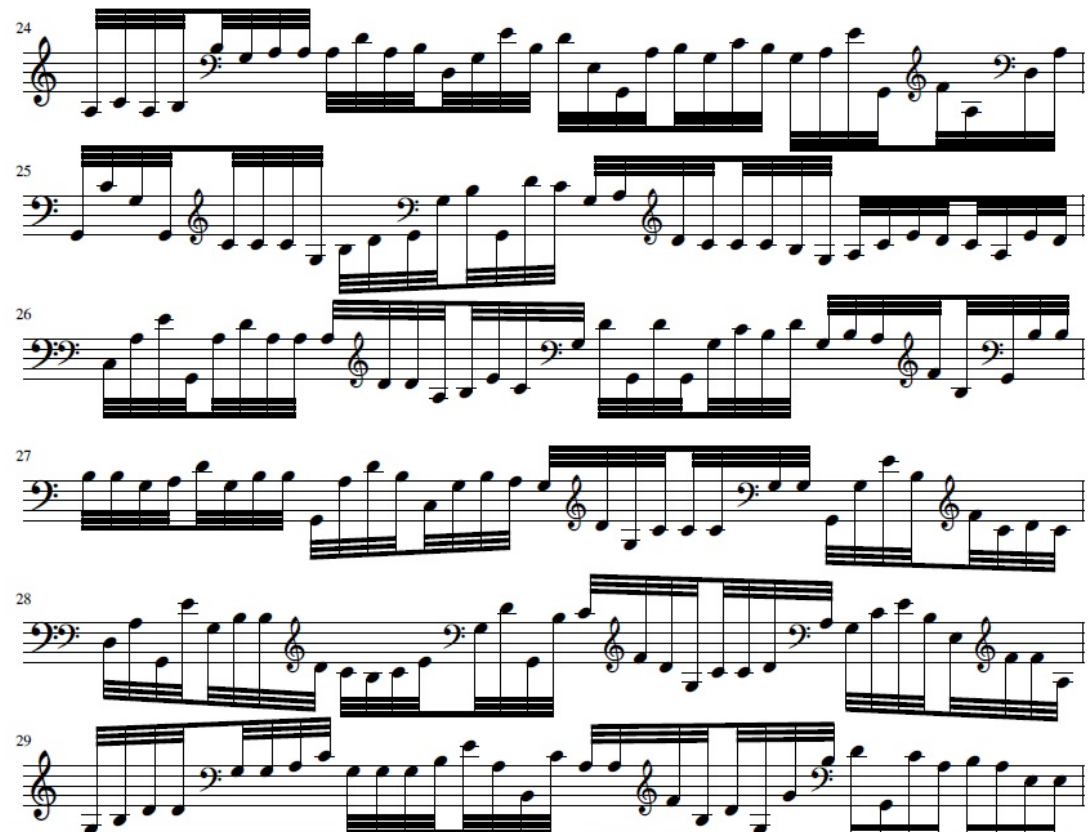
Fig. 5. BACS normal distribution random music sample