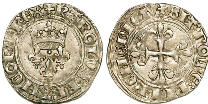
Gros dit florette sous Charles VI le Fou 49

初の例はシャルルVI世の治世の一部とシャルルVII世の治世を扱った Journal de Clément de Fauquembergue に求められる。1421年11月3日の記録は通貨の新しい流通レートと新規に铸造される通貨についての勅令に言及している 45 。この勅令は前年の7月3日までは20トゥール・ドゥニエで流通していた20ドゥニエのグロ銀貨に関するもので、以降は5トゥール・ドゥニエあるいは2パリ・ドゥニエの価値しかなくなることを定めたものである。勅令は同時により低い値の新規铸造貨幣を流通させることを告示している。その貨幣は2ドゥニエ半の価値となる 46 。さらに記録者はシャルルVI世下における1391年4月8日以来のマルク銀貨の相場に言及するのだが、1417年9月21日のマルク銀貨に言及した折に、20トゥール・ドゥニエのグロ銀貨へ触れ、それが巷で「gros à l'ueillet」と呼ばれていることを記録しているのだ 47 。シャルルVI世の治世に铸造されたグロ銀貨は「gros à florette」と呼ばれ、表には王冠を戴く3つの王家のユリの紋章、裏には各々の先端に王家のユリをつけた十字が打たれ、第1クォーターと第4クォーターに小さな王冠が打たれている 48 。