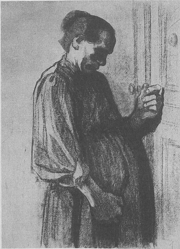
Abb. 3: Käthe Kollwitz: Beim Arzt, 1908/09. Blatt 3 der Folge: Bilder vom Elend. Aus: Käthe Kollwitz: Druckgraphik, Plakate, Zeichnungen, hrsg. v. Renate Hinz, 2. Aufl., Berlin 1981.

dargestellte Tat zu sein scheint. Das Bild vereint somit zwei von der KPD in der politischen Auseinandersetzung bevorzugte Argumentationsstrategien: Die schwangere Proletarierin kennzeichnet die Abtreibungsproblematik als soziales Phänomen, welches im Klassenkampf durch „die solidarische Aktion der Frauen gegen Gesetzgeber und Kirche“ 82 gelöst werden kann. Das Gemälde ist von daher eines der wenigen Kunstwerke von Frauen, welches teilweise die Ebene der zunächst individuellen Auseinandersetzung zugunsten des allgemeinen politischen Diskurses verlässt. Allerdings liegt die Vermutung nahe, dass Lex-Nerlinger mit der Figur der anonymen, schwangeren Proletarierin bewusst eine Anbindung an spezifisch weibliche Thematisierungskonzepte schafft. Sie erinnert in Form, Kleidung und Körperhaltung stark an Darstellungen betroffener Frauen von Käthe Kollwitz.