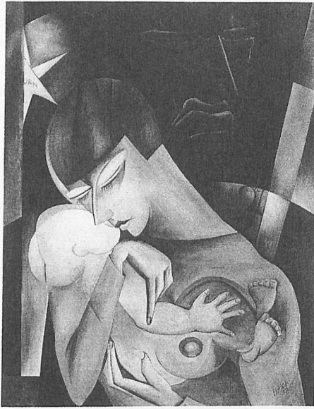
Abb. 5 Hannah Höch: Frau und Saturn, 1922. Aus: Unter anderen Umständen. Zur Geschichte der Abtreibung. Katalog zur gleichnamigen Ausstellung des Deutschen Hygiene-Museums Dresden, Berlin 1993, S. 143.