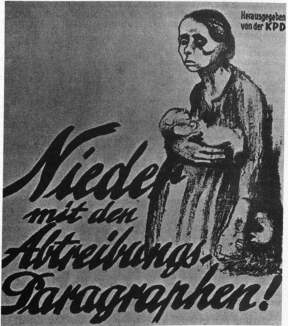
Abb. 2: Käthe Kollwitz: Plakat „Nieder mit dem Abtreibungsparagraphen“, 1924. Aus: Unter anderen Umständen. Zur Geschichte der Abtreibung. Katalog zur gleichnamigen Ausstellung des Deutschen Hygiene-Museums Dresden, Berlin 1993, S. 143.

Das Bild ‚Paragraph 218‘ von Alex Lex-Nerlinger zeigt eine Gruppe anonymer Frauen, die in einer gemeinschaftlichen Aktion ein Holzkreuz mit der Aufschrift ‚§ 218‘ stürzen. Das Motiv wird am linken Bildrand von einer gesichtslosen schwangeren Frau in einfacher Kleidung überschattet, die sowohl Anklage als auch Begründung für die