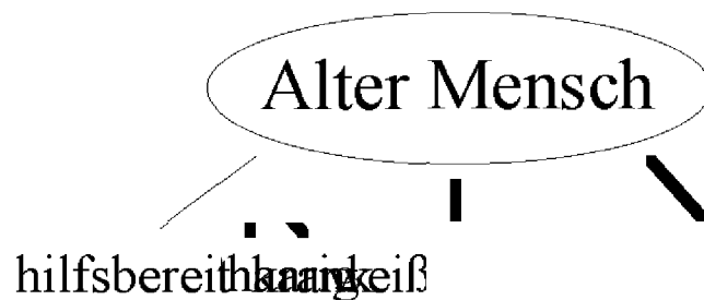
Abbildung 3.1: Hypothetische kognitive Repräsentation der sozialen Kategorie älterer Personen im semantischen Gedächtnis

Die Annahme des Assoziationsmodells geht davon aus, daß Individuen über abstrakte Wissensrepräsentationen spezifischer Charakteristika im semantischen Gedächtnis 1 verfügen, welche sie Mitgliedern unterschiedlicher sozialer Gruppen zuschreiben. Im semantischen Gedächtnis liegen Informationen in einem Netzwerk miteinander verbundener Einheiten vor (Anderson, 1983). Für die Aktivierung von Stereotypen 2 und stereotyp-geleiteter Informationsverarbeitung ist die Verbindung zwischen dem Etikett der jeweiligen kognitiven Einheit, d.h. einer sozialen Kategorie (wie z.B. „Mann“, „Arzt“ oder „Fußballfan“) und spezifischer Charakteristika (wie z.B. „stark“, „reich“ oder „aggressiv“) durch mentale Assoziationen im semantischen Gedächtnis relevant. Die theoretische Grundlage hierfür bilden Arbeiten der Kognitiven Psychologie zu „kognitiven Netzwerken“ (vgl. Anderson, 1983) und den damit verbundenen Annahmen des spread of activation (vgl. Collins & Loftus, 1975). Ein Beispiel für eine potentielle mentale Repräsentation findet sich in Abbildung 3.1: