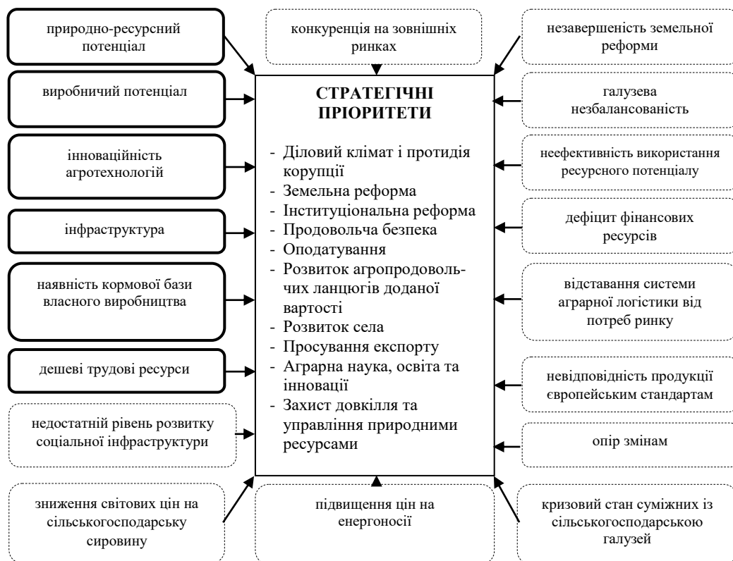
Рис. 2. Схема систематизації проблемних (позначені пунктирними прямокутниками) та перспективних (позначені потовщеними прямокутниками) факторів на стратегічні пріоритети розвитку АПК в Україні [розроблено авторами]

Проаналізувавши проблемні та перспективні фактори розвитку АПК України, ми провели їх систематизацію (рис. 2).