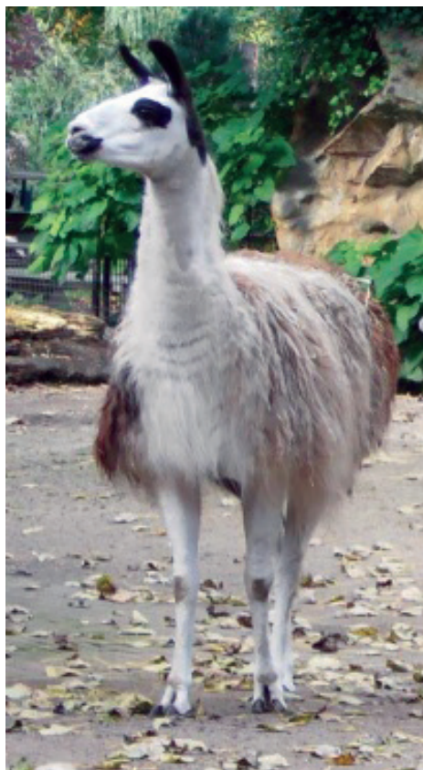
Slika 2. Ljama

su pred ovulaciju promjera 13-20 mm. Veliki anovulatorni folikuli (25-60 mm) su prisutni u oko 50 % ženki koje se nisu parile. Ovulacija se očituje pucanjem dominantnog ili Graafovog folikula te izbacivanjem jajne stanice u jajovod. Kad deva nije gravidna, CL je promjera 12-15 mm i mase oko 1,5-2 g, a gravidna u prosjeku je veličine od 22-28 mm i 4,9-6 g mase. U slučaju da ne dođe do koncepcije dolazi do regresije CL 10-12 dana od neuspješnog parenja. U gravidnih se deva regresija CL javlja neposredno pred porođaj (Đuričić, 2018.). Jajnici u ljama i alpaka su parni elipsoidni do okrugli, a u mladih jedinki su zbog brojnih malih folikula bočno spljošteni i neravne površine (Vaughan