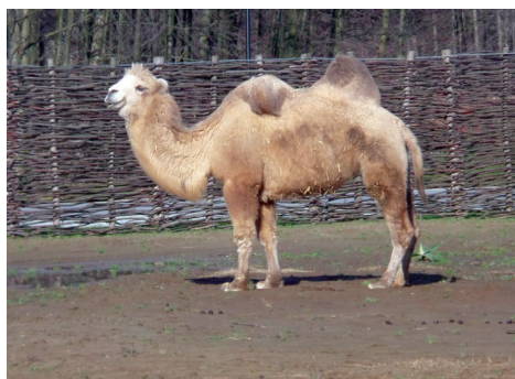
Slika 1. Dvogrba deva

baktrijska deva ( C. bactrianus ). U deve Novog svijeta ili južnoameričke kamelide (Wheeler, 2012.), spadaju dvije domaće: ljama ( Lama glama ) i alpaka ( Vicugna pacos ) te dvije divlje vrste: gvanako ( Lama guanicoe ) i vikunja ( Vicugna vicugna ). Smatra se da je 40 % ljama (Slika 2.) i 80 % alpaka hibridizirano. Cilj je ovog rada bolje upoznati reprodukciju kamelida. Unatoč tome što ova porodica nije toliko zastupljena i gospodarski značajna u Hrvatskoj, u nas, osim što predstavlja atrakciju, sve je veći trend uzgoja ovih životinja kao kućnih ljubimaca.