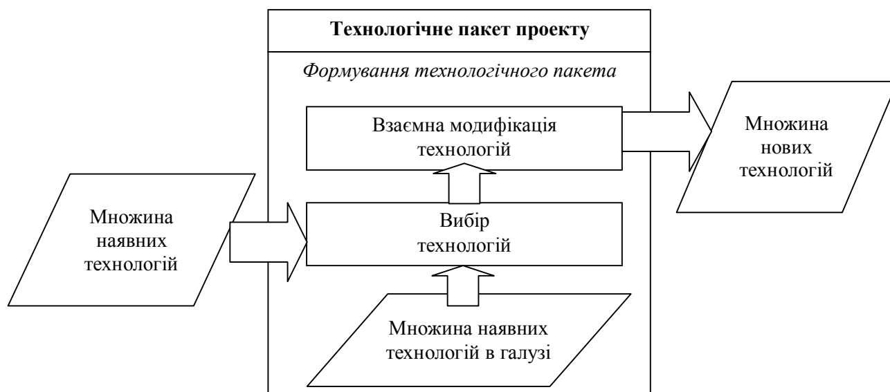
Рисунок 2 – Схема формування технологічного пакету

Жеков Ж., Омельяненко В.А. Аналіз особливостей розвитку мереж підтримки високих технологій в космічній галузі // Інформаційні процеси, технології та системи на транспорті. – К.: НТУ, 2014. – Випуск 2. – С. 89–97