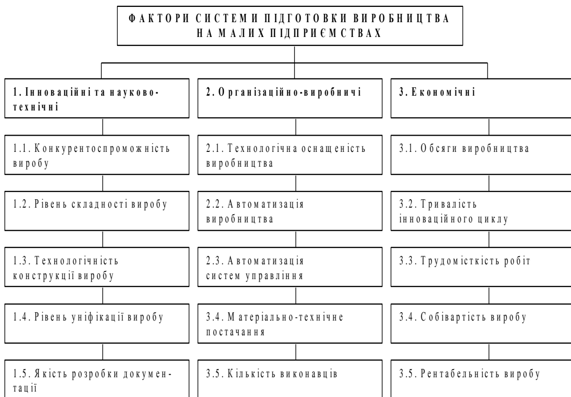
Рис. 1. Класифікація факторів системи підготовки виробництва на малих підприємствах

При визначенні факторів підготовки виробництва, які включаються до економіко-математичної моделі, ми виходили з основного принципу – можливості кількісної оцінки конкретних факторів до початку проведення планування робіт. В роботі сформована інформаційно-аналітична база даних, яка забезпечує процеси моделювання (нормативні, розрахунково-аналітичні).