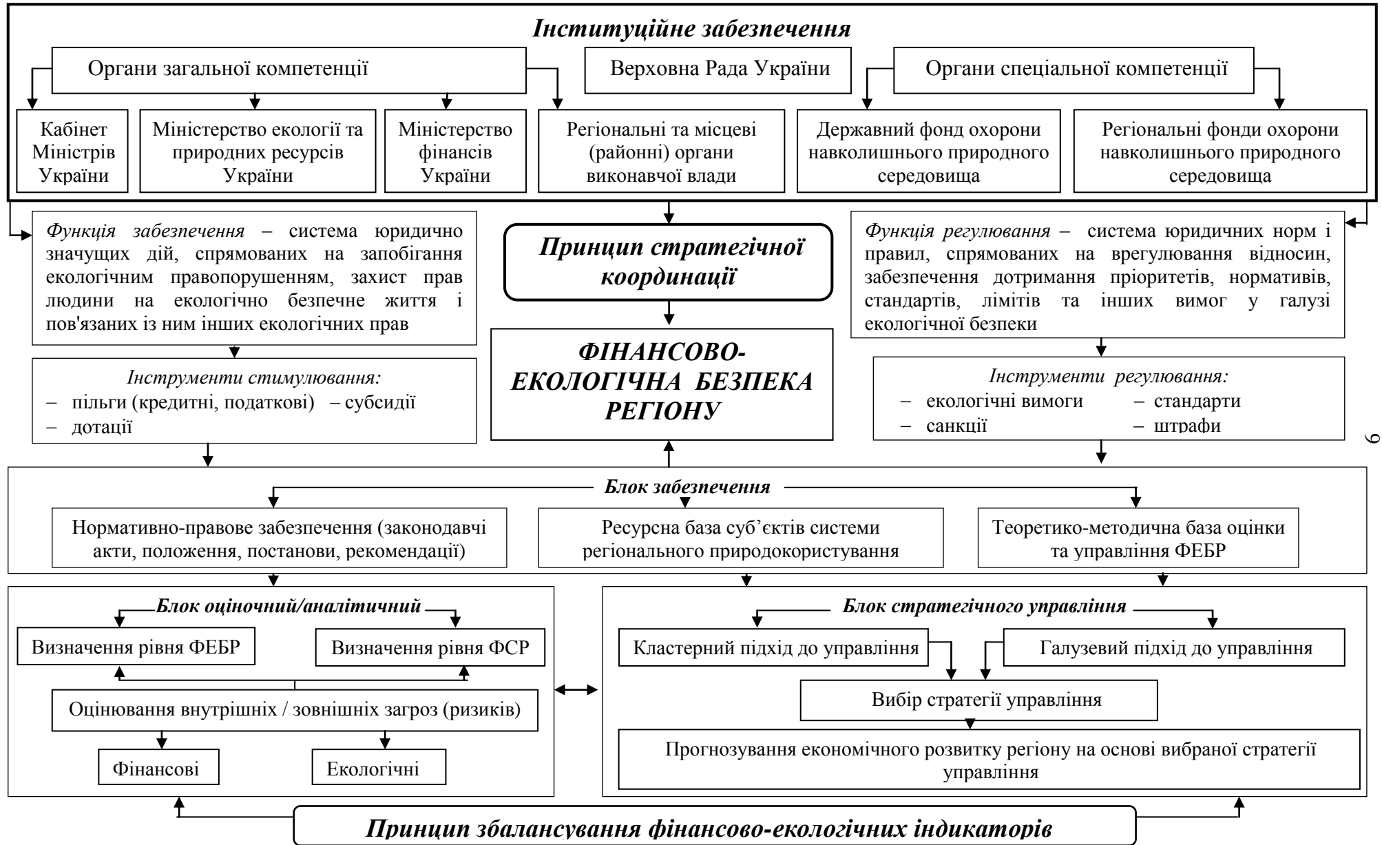
Рис. 2. Структура організаційно-економічного механізму управління ФЕБР