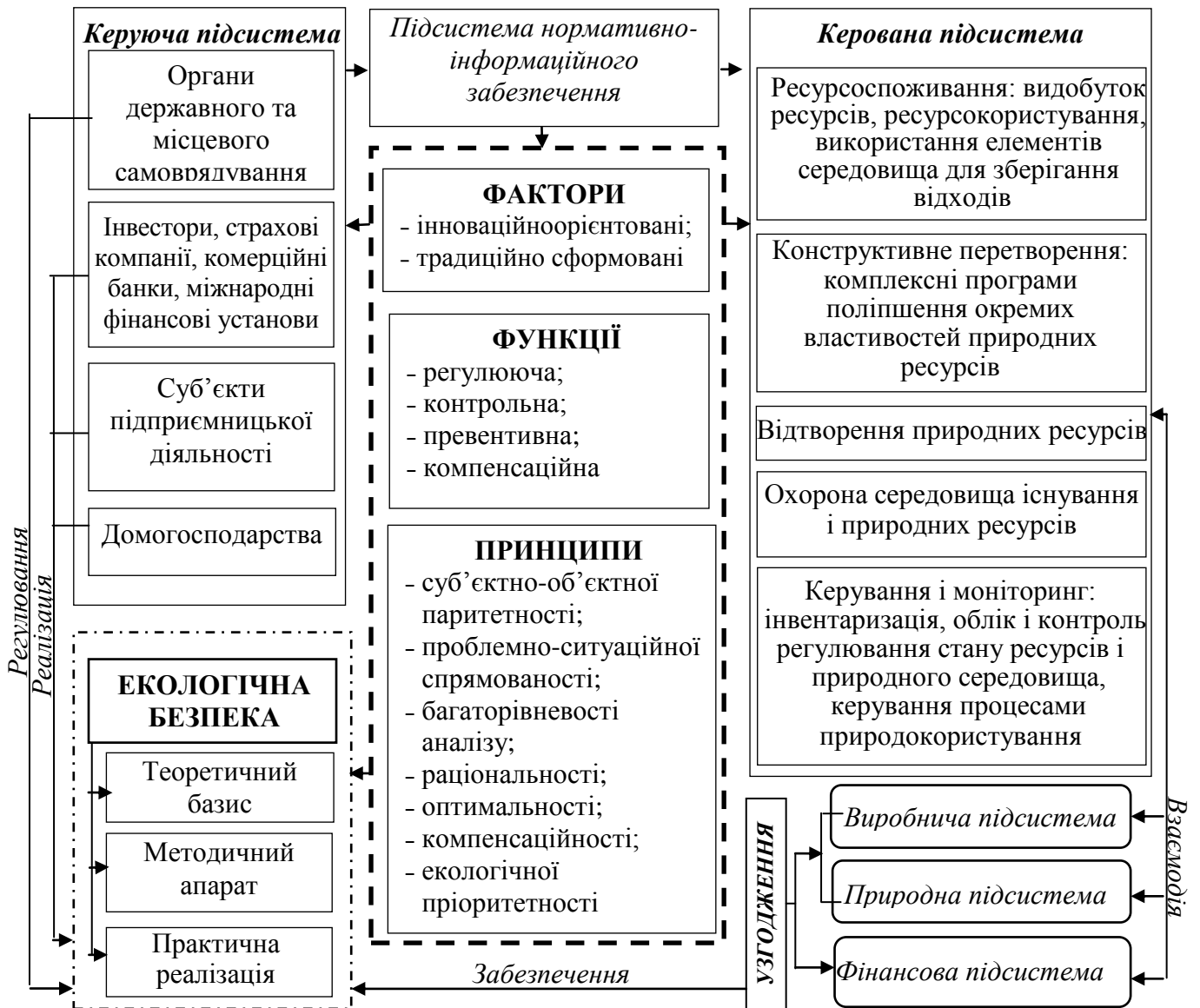
Рис. 1. Місце екологічної безпеки в СРП

4) в основу оцінювання показників екологічної безпеки покладене узгодження функціонування економічної та природної підсистем у сукупності, з одного боку, з фінансовою підсистемою, – з іншого;