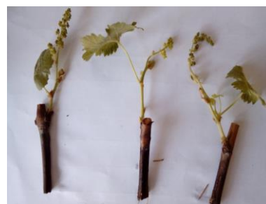
1. ábra: A rügydugványok hajtása