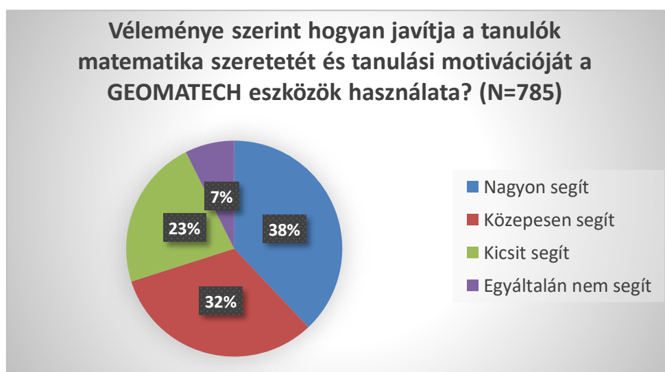
2. ábra: GEOMATECH célok

A 38 kérdésből álló kérdőív felmérte a pedagógusok előzetes ismereteit, hogy mely területeken milyen mértékben fejlődtek, illetve, hogy milyen felhasználási területeit látják a képzésen tanultaknak. Azzal kapcsolatban, hogy javítja-e a tanulók matematikaszerezetét, tanulási motivációját a GEOMATECH eszközök használata, a pedagógusok 93% válaszolt „igen”-nel. 70%-uk szerint nem is kis mértékben, hanem közepesen vagy nagyon segítenek a tanulói motivációban.