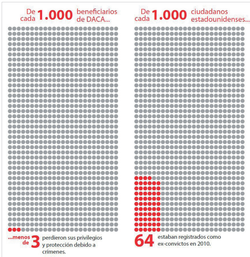
Figura 1. Representación intuitiva de proporciones

Para comprobar el poder de la visualización de datos para detectar tendencias y patrones, intente extraer alguna historia interesante de la figura 2, una porción de una base