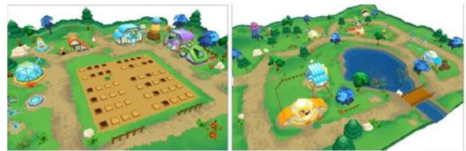
Gambar 6: visual background

Game ini dibuat dengan pandangan perspektif, dimana kamera diposisikan di samping atas avatar dan menghadap ke arah avatar player dengan sudut 40 hingga 60 derajat. Tujuan dari pemosisian kamera dengan sudut tersebut adalah agar pergerakan avatar dan environment disekitarnya nantinya terlihat dengan jelas, sehingga player dapat menggerakkan avatar untuk mengerjakan suatu aktivitas dengan lebih leluasa.