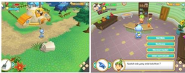
Gambar 8: Desain Interface game

Interface utama terdiri atas stamina player, pengalaman dan level, uang, tanggal dan musim, pengaturan, misi, dan peralatan yang digunakan.