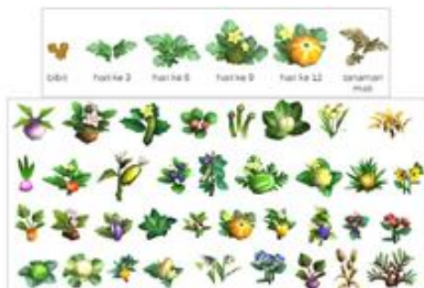
Gambar 5: visual Tanaman organik

Pada game ini, terdapat 38 jenis tanaman produksi baik lokal maupun global. Terdapat lima tahapan pertumbuhan pada tanaman, dan setiap tanaman dapat mati apabila tidak disiram secara teratur selama tiga hari berturut-turut dan sudah mengalami fase panen dengan jumlah tertentu (untuk tanaman panen lebih dari sekali). Setiap rentang periode tertentu tanaman tumbuh dari tahapan satu (bibit) ke tahapan berikutnya, dan seterusnya hingga fase panen.