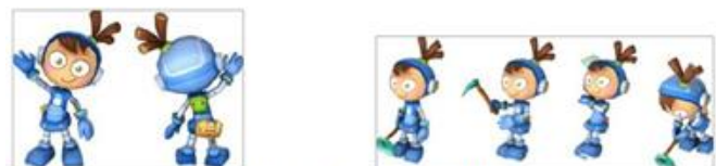
Gambar 3: Karakter utama

Pertimbangan utama dalam mengembangkan desain karakter dalam game ini lebih ditekankan pada analisis target audiens sebagai pengguna game edukasi. Karakter player memiliki 12 gerakan aktivitas bertani maupun beternak, serta gerakan berjalan, menunggu, dan kehabisan energi.