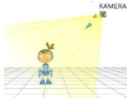
Gambar 7: perspektif kamera