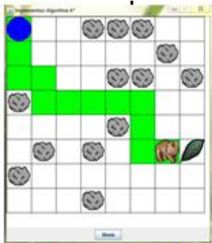
Gambar 1: penerapan algoritma A* pada game