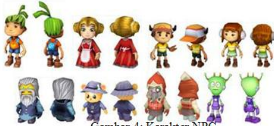
Gambar 4: Karakter NPC

NPC adalah karakter yang dimunculkan di dalam game, terlibat secara aktif dalam kegiatan yang dilakukan oleh karakter player, akan tetapi tidak bisa dikendalikan oleh player. Pada game Astro Farmer terdapat tujuh NPC diantaranya bernama Subur, Chiya, Toni, Tina, Kakek Jiji, Berung, Pippo, dan Leoni. Animasi NPC terdiri atas animasi berbicara dan menunggu.