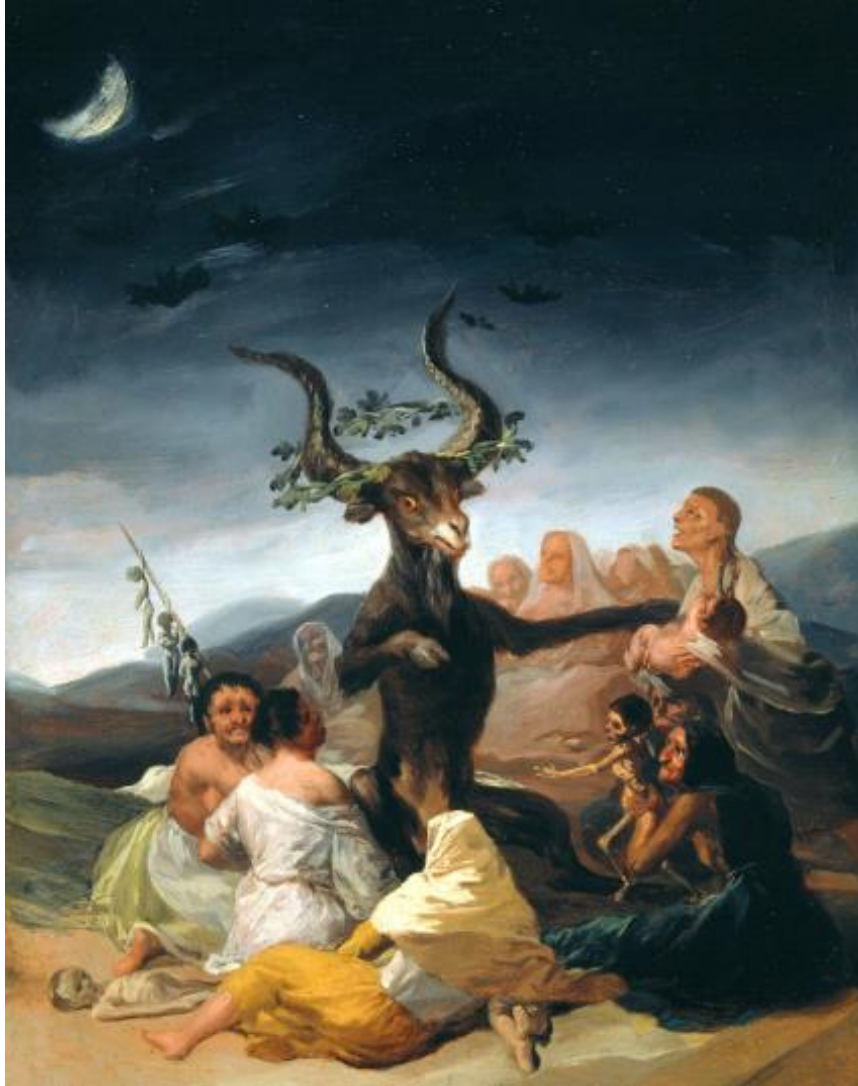
Francisco de Goya. El aquelarre . 1798.

mayor número de víctimas por caza de brujas. El tratado más destacado en la caza de brujas fue el Malleus Maleficarum , escrito por dos monjes inquisidores medievales. Otros como el Compendium maleficarum (1608) de Francesco María Guazzo, describía las ceremonias realizadas por los hechiceros para participar en los aquelarres. 31