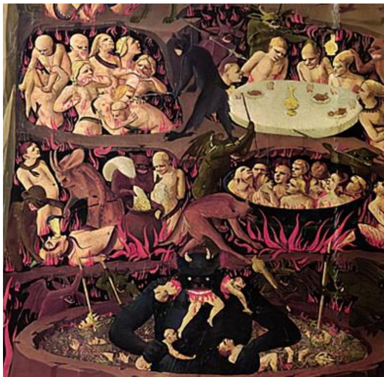
Fra Angelico. El Juicio Final . 1431.

El imaginario sobre el Infierno estaba muy presente en la Edad Moderna. Se imaginaban un lugar angustioso, una gran caverna rodeada de fuego, elementos de tortura, lúgubre y desagradable. Esa creencia la vemos reflejada en la iconografía de la época que alcanzará su máximo esplendor en los siglos XV-XVI, con los cuadros de Van Eyck, Fra Angelico, el Bosco... 37 o en la escultura. Además en la literatura será muy común la descripción del infierno, así como en representaciones teatrales que se hicieron muy populares.