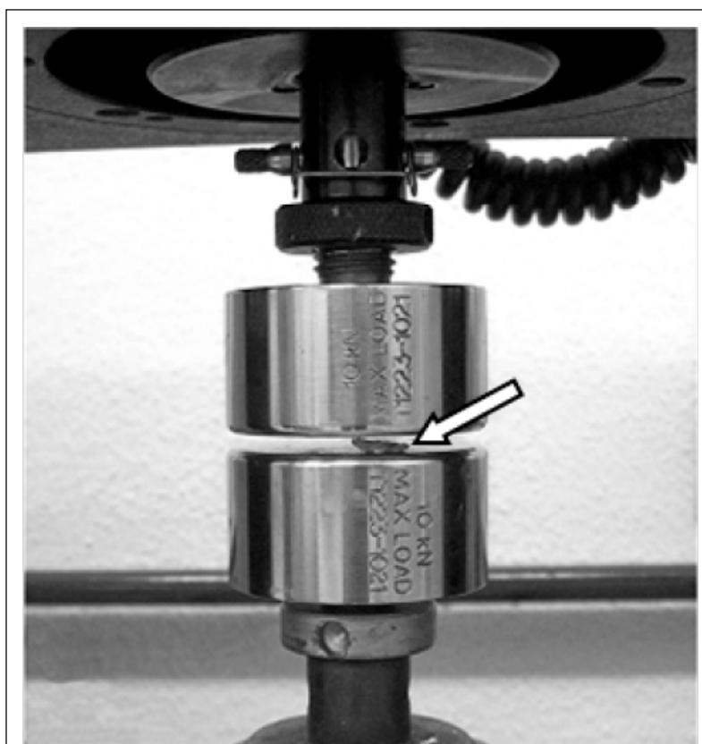
Figura 1 - Aspecto do teste mecânico de compressão. Os meniscos (seta) foram colocados na superfície da barra de compressão inferior e a carga foi aplicada.

glicerina e reidratados - MR foram de 32,5N e 36,3N, respectivamente (Tabela 1 e Figura 2A); o que significa que os meniscos dos grupos preservados em glicerina - MG e MR e o grupo de meniscos frescos - MF, recém-coletados, tiveram a capacidade de suportar a mesma força ao limite elástico e que o método de preservação não influenciou, negativamente, esta propriedade biomecânica.